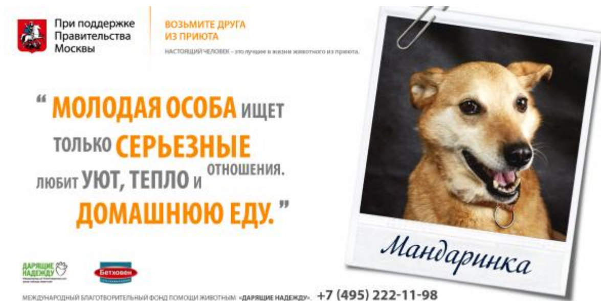
Рис. 1. Социальная реклама, призывающая взять собаку из питомника

полноценного анализа объявлений, содержащих тексты, подобные тексту на рис.1, а также аналогичные им (например, из той же рекламной кампании: «РОМАНТИЧНЫЙ юноша ищет КОМПАНИЮ. Приятен В ОБЩЕНИИ. Обожает ПРОГУЛКИ В ПАРКЕ.», «СИМПАТИЧНАЯ девушка ищет ДРУЗЕЙ. УМНАЯ. Стройная. В еде НЕПРИВЕРЕДЛИВАЯ.»)