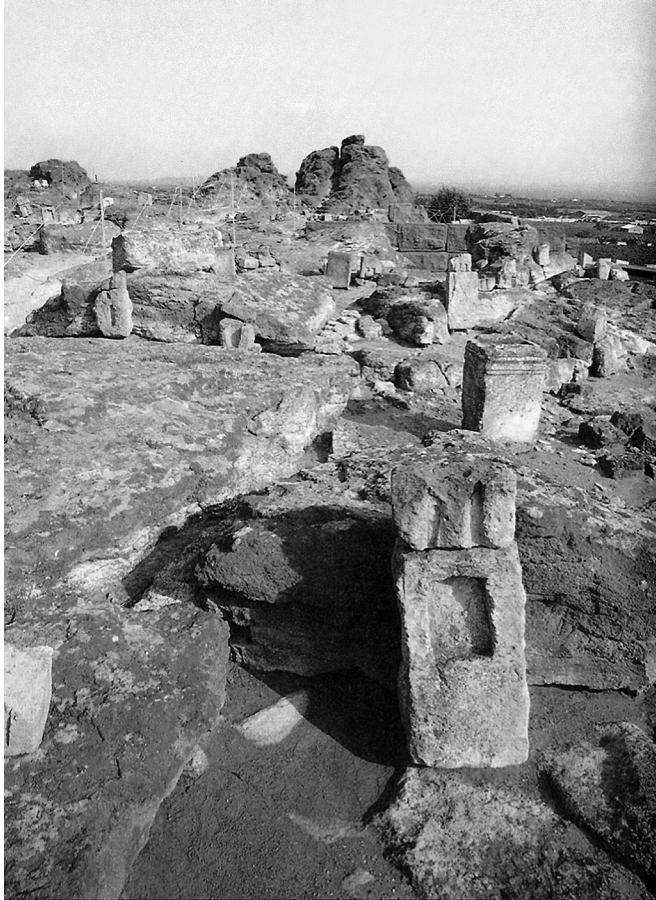
Figure 1 : Le tophet de Sulcis, Sardaigne