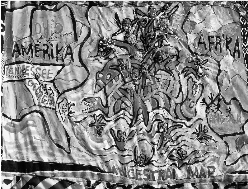
Figure 2 : L'ancestral map (Cincinnati, National Underground Railroad Freedom Center)