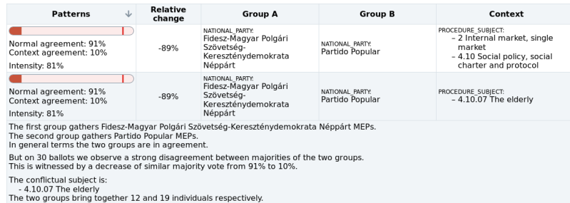
FIG. 2 – Motifs de désaccord entre le Fidesz et le Partido Popular - Le texte décrit le motif

le Partido da Terra (Portugal), et le Centre Démocrate Humaniste (Belgique, mentionné dans l'article), tous deux constitués d'un seul député et présentant respectivement un accord habituel de 75% et 76% avec le Fidesz. Les partis qui présentent des situations d'accord exceptionnel avec le Fidesz, et qui sont donc dans le cas général suffisamment en désaccord avec, sont les mêmes que précédemment. À noter qu'ils sont constitués de peu de membres.