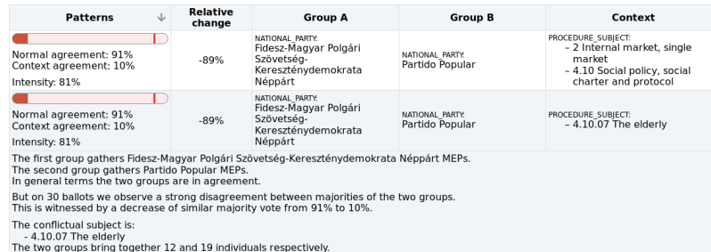
FIG. 2 – Motifs de désaccord entre le Fidesz et le Partido Popular - Le texte décrit le motif

le Partido da Terra (Portugal), et le Centre Démocrate Humaniste (Belgique, mentionné dans l'article), tous deux constitués d'un seul député et présentant respectivement un accord habituel de 75% et 76% avec le Fidesz. Les partis qui présentent des situations d'accord exceptionnel avec le Fidesz, et qui sont donc dans le cas général suffisamment en désaccord avec, sont les mêmes que précédemment. À noter qu'ils sont constitués de peu de membres.