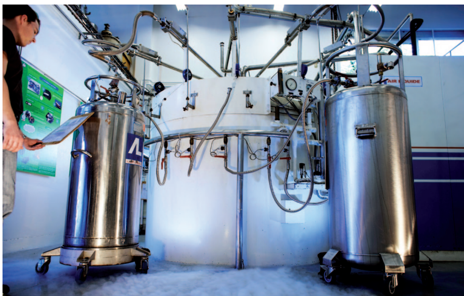
1. Centre de liquéfaction d'hélium (CNRS - Institut Néel, Grenoble).