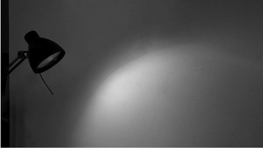
Figure 2 : Image extraite de la vidéo « L'appartement quantique », Natacha Poutoux.

Le silence omniprésent dans la vidéo produit une tension et est un geste créatif. Il joue comme le blanc dans le cas de Paul, il produit une sorte de climat originel. Il est efficace, aussi, pour sa capacité à mettre en évidence les moindres bruits produits par l'objet quotidien en usage et concentre ainsi l'attention sur l'objet. Dans tous les cas, Natacha produit des effets spéciaux grâce à un jeu de montage relativement simple (une crêpe traverse un mur, d'un plan à un autre, par exemple). En outre, elle n'invente pas de nouveaux objets. Elle s'appuie sur des objets quotidiens et banals qui deviennent les supports de gestes tout aussi banals mais qui, mis bout à bout, produisent un sentiment d'étrangeté. La transposition d'un effet quantique en un objet ou une situation du quotidien exacerbe la singularité du phénomène quantique. En ce sens, le procédé employé par Natacha est clairement métaphorique : l'univers quotidien, en tant que comparant qui se substitue complètement au comparé, révèle l'étrangeté de l'élément comparé.