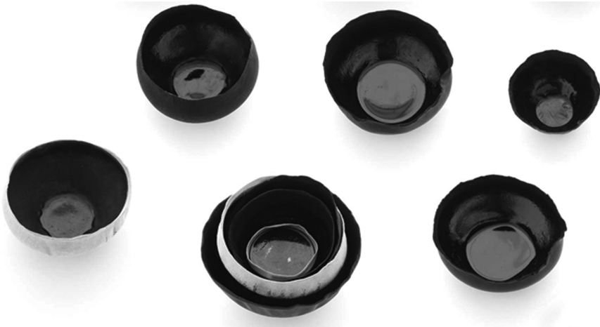
Figure 4 : Image extraite de l'exposition des objets « Démarche sous influence », Émile Kirsch.

animées, livres pour enfants, vêtements, matières, contenants, sacs à mains... À la différence de Natacha, qui utilise des objets existants, les objets présentés sont conçus pour l'occasion, mais à la différence de Marianne, ils sont des objets du quotidien. L'inspiration est soit associée à une propriété quantique, par exemple la dualité pour les vêtements à la fois liquides et solides, soit associée pour la méthodologie et le processus créatif au comportement quantique (incertitude de la mesure, saut brutal, plusieurs possibilités en parallèle...): Émile explore la physique quantique pour influencer son propre comportement créatif et sa méthodologie de travail.