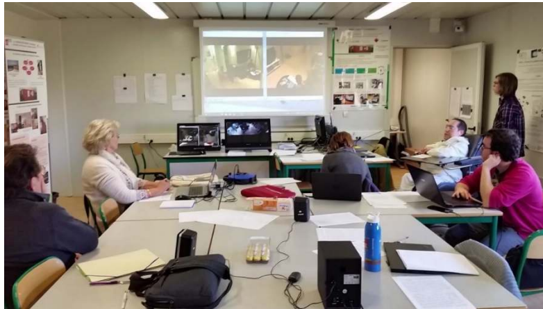
Figure 4. Salle d'observation

La Figure 4 représente la salle d'observation (présence de l'ensemble des chercheurs où chacun assure son rôle d'observateur avec son regard propre à son champ de compétence). La Figure 5 illustre une situation d'interaction d'une personne âgée, équipée d'un outil du suivi du regard, avec une tablette tactile dans le cadre de l'exécution d'un scénario d'activités.