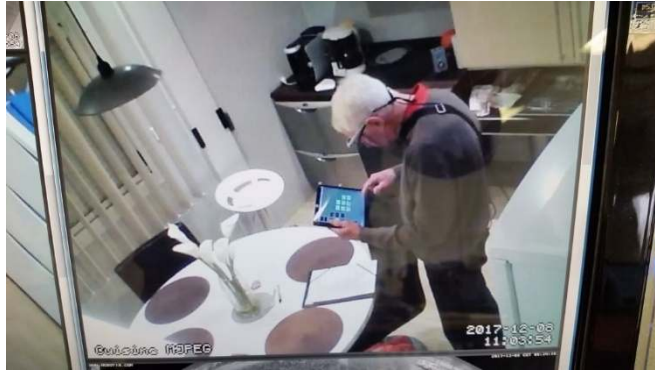
Figure 5. Personne en situation d'interaction

La durée totale d'une passation variait entre 2 h 30 et 3 h 30 selon le participant. Les risques techniques (hétérogénéité des dispositifs de mesure) et éthiques (information au participant de l'objectif de l'étude, lettre de consentement, droit à l'image, information sur la possibilité d'arrêter sa participation à chaque instant, confidentialité et sécurisation des données) ont été neutralisés.