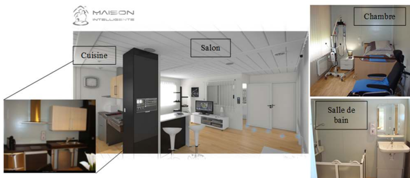
Figure 1. La Maison Intelligente de Bagnac (MIB)

La méthodologie a été déployée au sein d'un Living Lab , la Maison intelligente de Bagnac (MIB) illustrée par la Figure 1 (Campo, Daran et Redon, 2011).