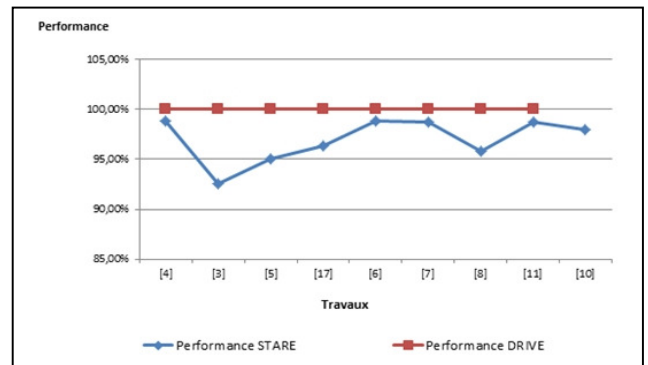
Figure 3 : Taux de détection de base des données STARE & taux de détection de base des données DRIVE.

On note que les méthodes proposées par Zhang et al [6], par Soares et al[7] et par Hashim et al [4] atteignent les meilleures taux de détection. Néanmoins, la méthode proposée par Hashim et al [4] n'est pas entièrement automatique. Par conséquent, on déduit que les méthodes qui utilisent les caractéristiques des vaisseaux sont les plus adéquats, pour le choix d'une méthode ayant une contrainte de taux de détection.