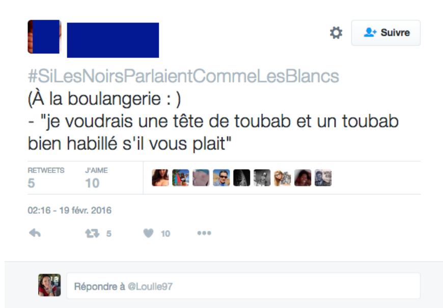
Illustration 13 : #SiLesNoirsParlaientCommeLesBlancs. La tête de toubab