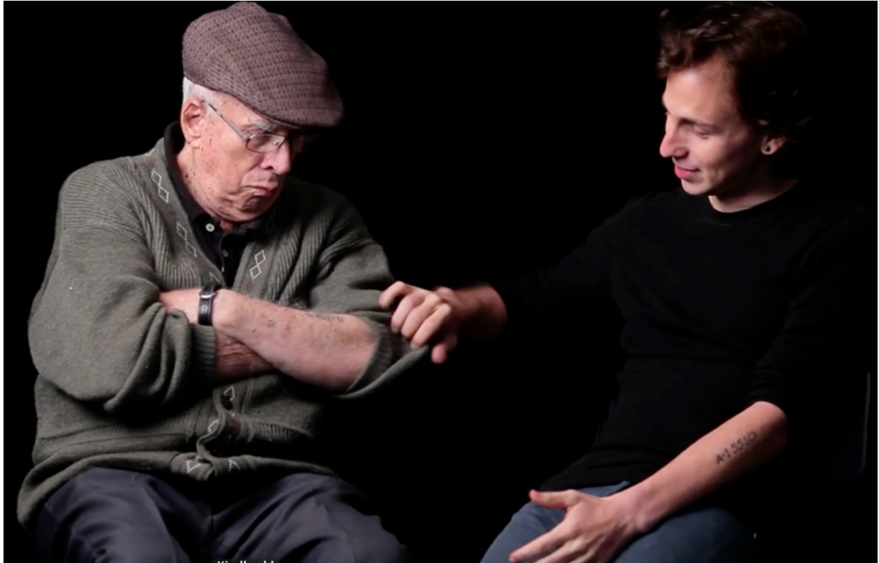
Illustration 11 : Extrait du film documentaire Numbered , 2012

emblématise le dispositif de resignification en montrant les deux numéros sur les deux corps.