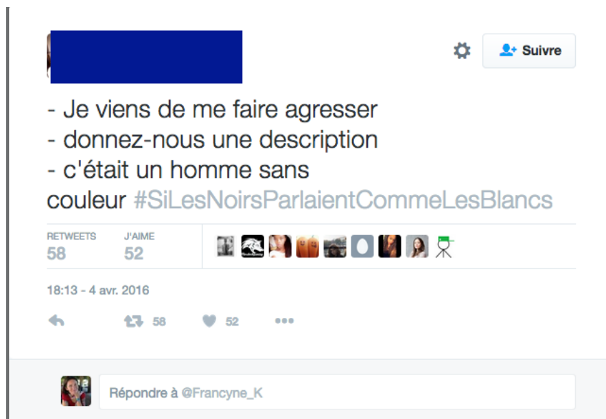
Illustration 14 : #SiLesNoirsParlaientCommeLesBlancs. L'homme sans couleur