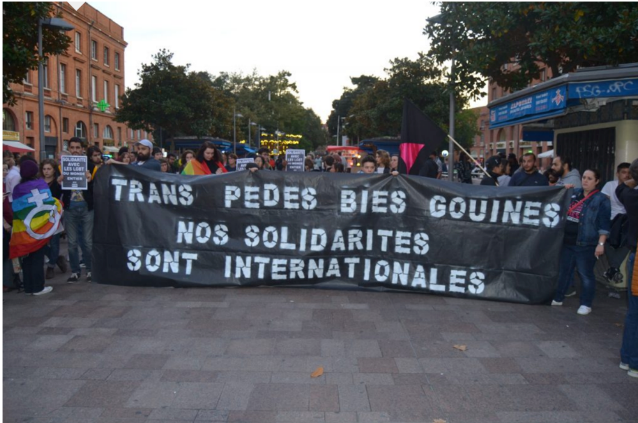
Illustration 3 : Manifestation du collectif TransPédésGouines, Bordeaux, s.d.

On trouve également des exemples isolés qui peuvent être des hapax, comme cet emploi mi-ironique mi-militant de l'adverbe tarlouzement à la fin d'un message sur une liste de chercheur.e.s :