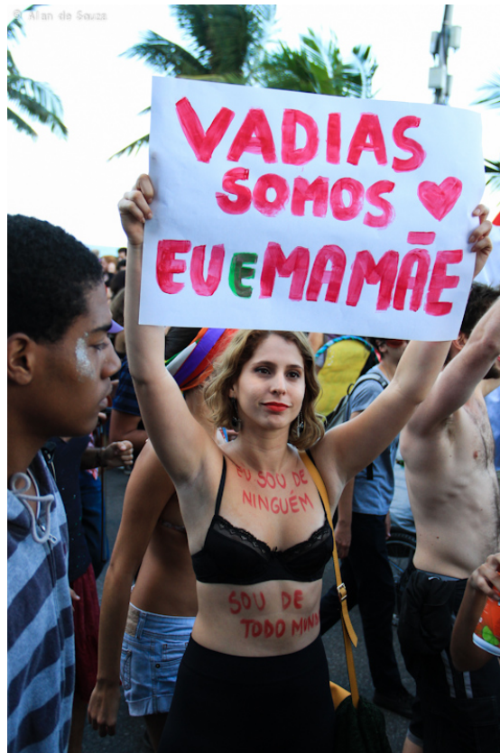
Illustration 5 : Pancarte traditionnelle, Marcha das Vadias , Rio de Janeiro, Brésil, 2013

La resignification à dominante lexico-sémantique est le stéréotype de la resignification : c'est elle qui est le plus souvent citée et commentée, dans les travaux des chercheur.e.s comme dans les actions militantes. J'en ai donné des exemples dans ce qui précède, exemples lexicalisés ou en tout cas enregistrés dans des documents de type lexicographique ou encyclopédique (comme Wikipédia cité plus haut). Ces formes sont mises en jeu dans des pratiques discursives militantes, donc le figement en « je suis », qui est celui de la resignification par excellence, car il exprime la réappropriation existentielle du trait stigmatisant. Cela explique de nombreuses occurrences écrites dans les manifestations : dispositif traditionnel de pancarte (Illustration 5), inscription corporelle (Illustration 6), variante corporelle faisant l'ellipse du « je suis » (Illustration 7), dispositif humoristique d'étiquette (Illustration 8).