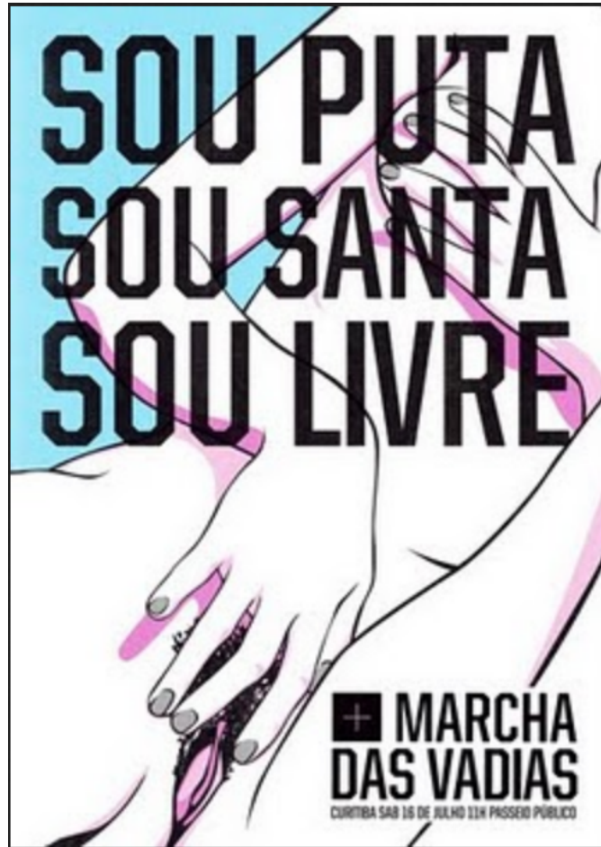
Illustration 2 : Affiche de la Marcha das Vadias à Curitiba, Brésil, 2011

Du côté des luttes pour les sexualités, les mots butch , dyke , gouine , pédé , appartiennent aux auto-dénominations courantes des lesbiennes et des gays reprenant à leur compte des insultes lesbophobes et homophobes. Le collectif bordelais « TanspédésGouines » par exemple, resignifie dans son nom même des termes chargés d'insultes, et les revendique comme appellatifs militants :