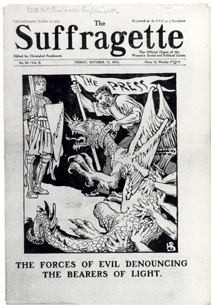
Illustration 1 : The Suffragette , édition du 7 octobre 1913

En Angleterre, les désignations politiques cavalier (vs roundhead , pendant la Première révolution des années 1640), whig ou tory sont des réappropriations de qualificatifs péjoratifs par ceux qui en sont désignés. Au XVIII e siècle, en France, le terme athée est également resignifié, l'athéisme passant d'une accusation externe, le terme étant alors calomnieux, à une profession de foi, la modification de la position énonciative entraînant une modification sémantique. On peut également citer jésuite , passé du qualificatif péjorant à la désignation neutre réappropriée (la péjoration restant cependant dans jésuitique ), sans-culotte , devenu un véritable étendard politique et même un mouvement socio-esthétique dans le Père Duchesne notamment, ou encore le célèbre suffragette , revalorisation d'un terme péjorant créé à partir de suffragist qui désignait au début du XX e siècle les premières féministes luttant pour le droit de vote. Suffragette est à ce point réapproprié qu'il devient le titre du journal de la Women's Social and Political Union (WSPU), l'association féministe la plus importante d'Angleterre au début du XX e siècle (Illustration 1).