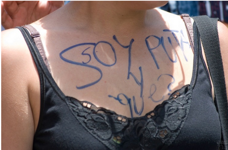
Illustration 6 : Inscription corporelle, Marcha de las putas , San José, Costa Rica, 2011