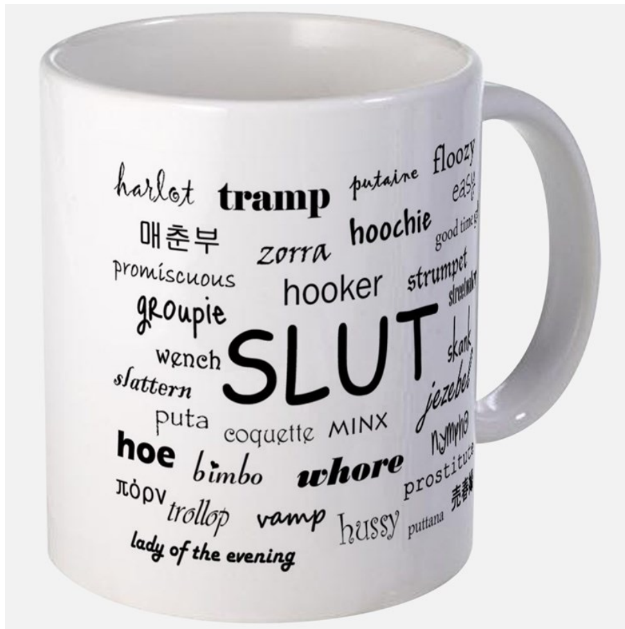
Illustration 10 : Slut mug , en vente sur le site Cafe Press