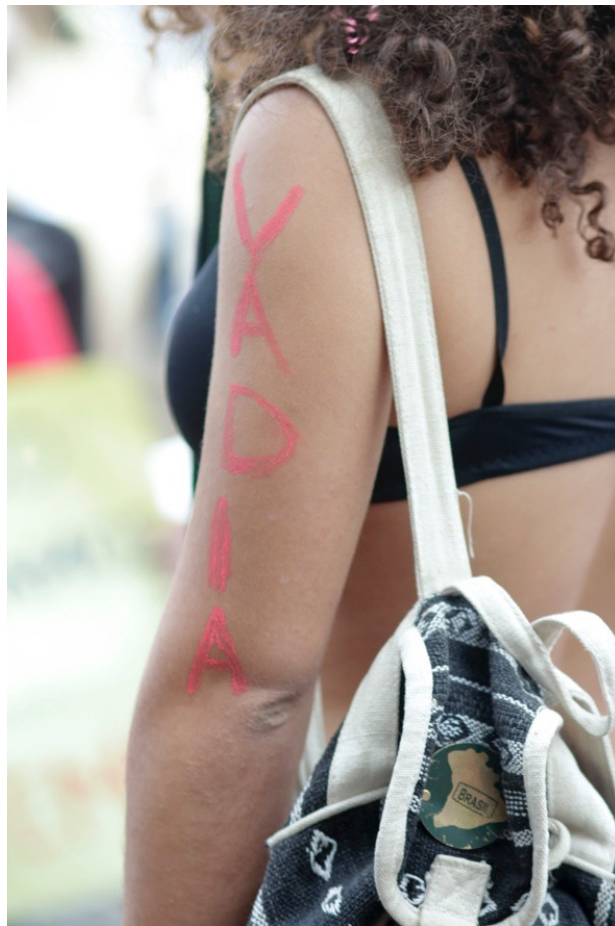
Illustration 7 : Inscription corporelle, Marcha das Vadias , Sao Paulo, Brésil, 2013