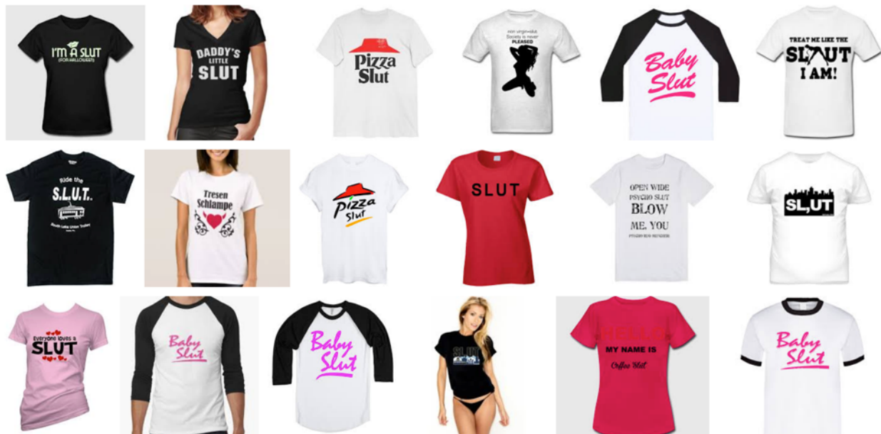
Illustration 9 : Premières images de la recherche Google « Slut tee shirts »

La forme lexico-sémantique peut aussi quitter l'interaction humaine militante pour entrer dans le règne des objets de manière ludique : la resignification inspire en effet des slogans décoratifs pour des vêtements ou de la vaisselle, comme le montrent les nombreux modèles de tee shirts proposés avec le slogan « Slut » ou de mugs en vente sur internet (Illustrations 9 et 10).