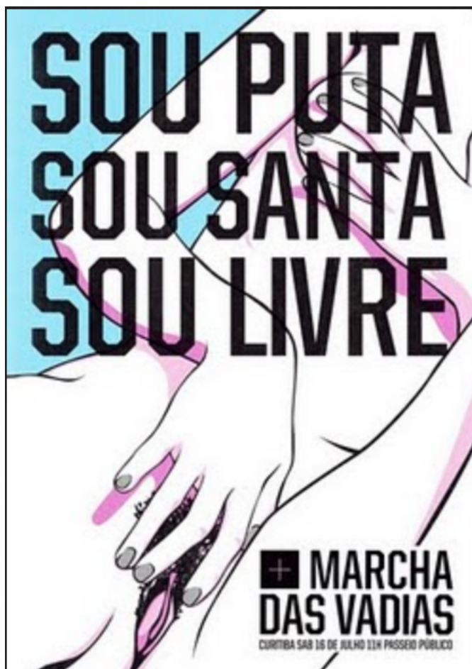
Illustration 2 : Affiche de la Marcha das Vadias à Curitiba, Brésil, 2011

Du côté des luttes pour les sexualités, les mots butch , dyke , gouine , pédé , appartiennent aux auto-dénominations courantes des lesbiennes et des gays reprenant à leur compte des insultes lesbophobes et homophobes. Le collectif bordelais « TanspédésGouines » par exemple, resignifie dans son nom même des termes chargés d'insultes, et les revendique comme appellatifs militants :