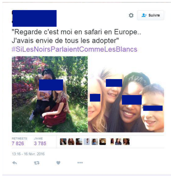
Illustration 15 : #SiLesNoirsParlaientCommeLesBlancs. Le safari

Tous les énoncés s'appuient sur les cadres préalables et partagés du discours raciste et contiennent des manifestations de mémoire discursive proche du dialogisme : allusion aux comparaisons stéréotypées entre les femmes noires et les fauves, mémoire lexicale des dénominations de gâteaux tête de nègre et nègre en chemise , usage du terme racialisant homme de couleur , anthropologie paternaliste du touriste occidental en visite chez les « peuples » d'Afrique. La resignification ici ne passe pas par l'appropriation d'un terme ou d'un énoncé stigmatisant, mais par la profération, dans un monde imaginé, d'une réponse ironique et ludique à des énoncés ou représentations racistes contenus dans les implicites des tweets cités et appartenant au monde factuel. Sont resignifiants ici l'inversion contrefactuelle et l'ironie qui sape les fondements du cliché raciste.