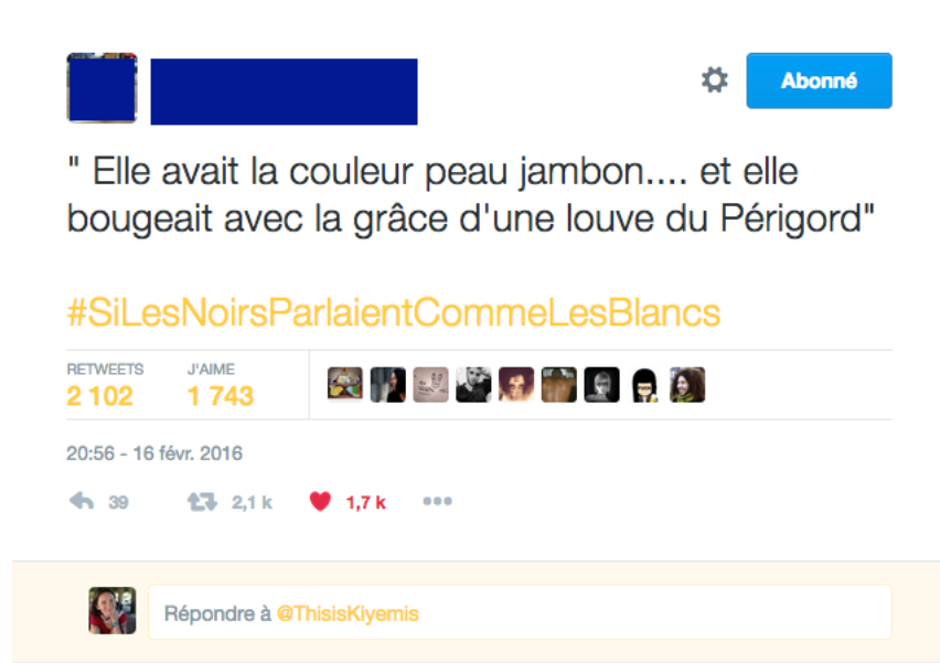
Illustration 12 : #SiLesNoirsParlaientCommeLesBlancs. La louve du Périgord