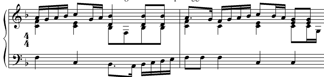
Exemple 1. Adrian Le Roy, First Branle of Malte

Comme l'exprime Silvestro Ganassi dans Regola Rubertina (1542), la diminution produit deux effets. Elle est d'abord un ornement de la composition, c'est-à-dire du contrepoint, et ensuite, « elle charme l'oreille dans le bel agencement des passaggi variés ».