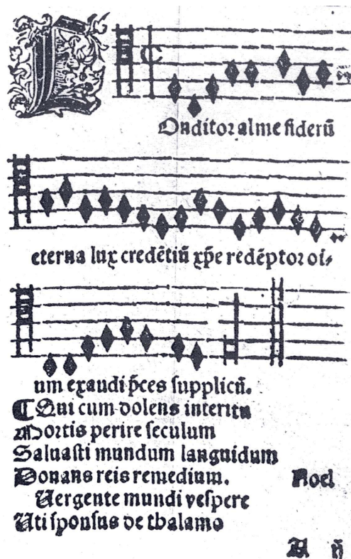
Jacques Moderne, La Fleur des noelz ...notés , (v. 1535), fol. Aii