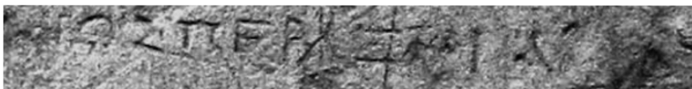
Figure 4 : st  le d'Hefzibah. D  tail de la fin de la l. 10. Photo    The Israel Museum, Jerusalem, by Vladimir Naikhin.