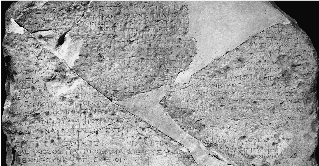
Figure 1 : stèle d’Hefzibah (l. 1-20). Collection The Israel Antiquities Authority. Photo © The Israel Museum, Jerusalem, by Vladimir Naikhin.