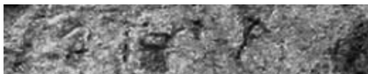
Figure 6 : stèle d'Hefzibah. Détail de la fin de la l. 8.

devient le document le plus ancien du dossier, daté de l'automne 202 (plus précisément du 22 septembre de cette année 45 ), deux ans avant l'envoi à Ptolémaïos 46 . Sur la photo digitale agrandie à l'écran 47 , nous distinguons en effet, vers la fin de la l. 8, des traces de lettres proches de celles déchiffrées par Johannes Heinrichs, dont la partie supérieure d'une lettre triangulaire, l' iota apparaissant sous la forme d'un tau , un omicron et, plus loin, les restes d'un alpha (?). Cependant, s'il s'agit de la fin d'un nom de mois, on peut tout aussi bien restituer [βιρ' Γορπι] ἄτο(ν) ἄ', an 112 de l'ère séleucide, I er jour de Gorpaios, soit le 2 août 200, ce qui nous paraît beaucoup plus satisfaisant pour l'enchaînement chronologique des documents A/I et B/II, qui auront ainsi été rédigés à deux mois d'intervalle l'un de l'autre au maximum.