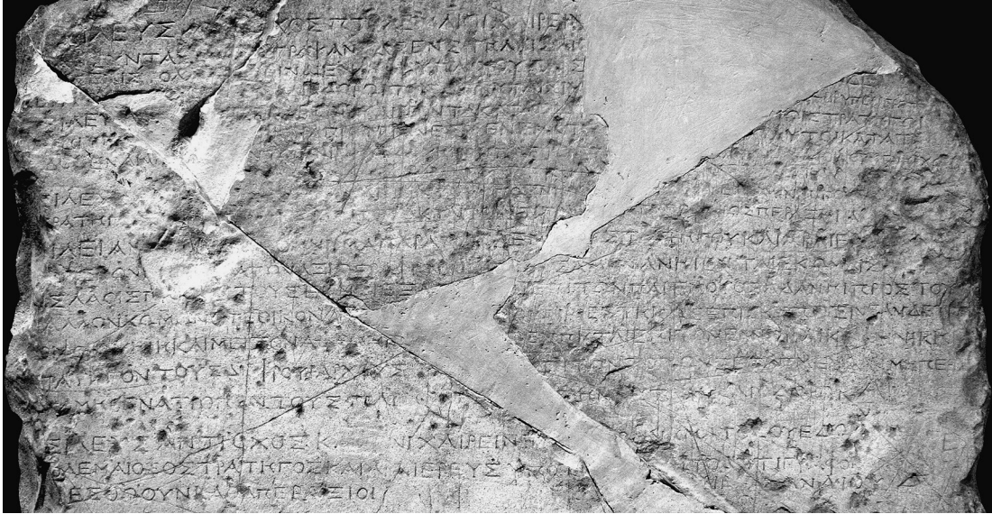
Figure 1 : stèle d’Hefzibah (l. 1-20). Collection The Israel Antiquities Authority. Photo © The Israel Museum, Jerusalem, by Vladimir Naikhin.