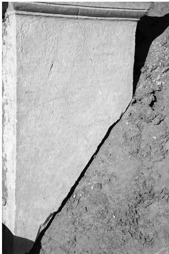
Figure 2 : vue rapprochée de la stèle au moment de sa découverte en 2011.

En 1996 avait été découverte à Claros la partie inférieure d'une haute stèle, qui portait la fin d'un décret d'Aigai d'Éolide pour des juges de Colophon ainsi que le décret de Colophon lui répondant. L'ensemble fut promptement publié par Ph. Gauthier en 1999 9 . Or la partie haute de la stèle a été mise au jour en 2011, et donne l'ensemble du décret d'Aigai (fig. 1 et 2) 10 . Il convient donc de publier et de commenter l'ensemble ainsi reconstitué (fig. 3).