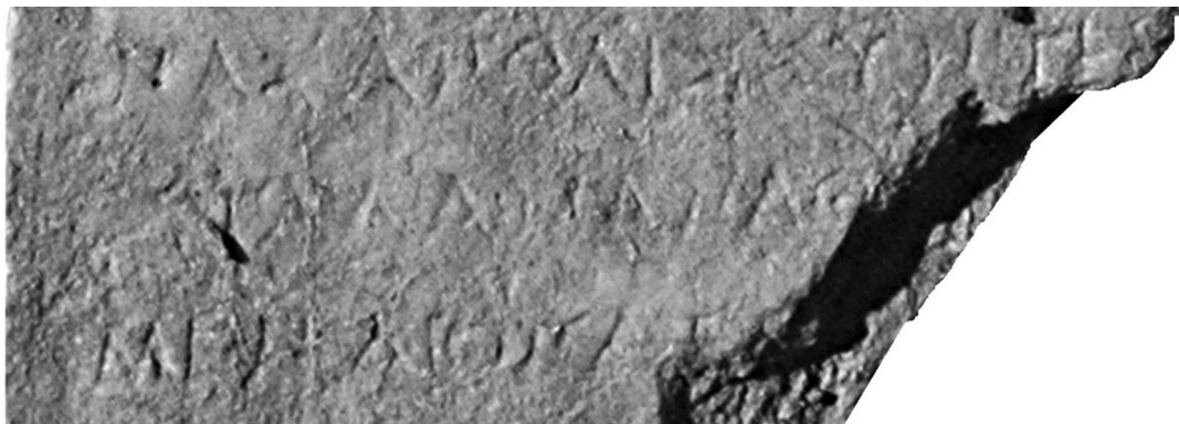
Figure 6 : détail du nouveau fragment (l. 30-32).

L. 32 : la lecture pose problème. P. Debord a lu et restitué : Ὁ πρέσ[βευς ἐχ]ειροτονήθη. La présence de l'article, inusuelle, est très surprenante, mais la lecture de l' omicron est certaine. L. 26, on a πρεσβεύταν , ici on aurait πρέσβευς . En effet, avec πρέσβευς , la ligne occupe 39 lettres (contre 36 lettres l. 31, jusqu'à δέαται ἐπ- , qui surplombe Διονύτα ) ; elle serait trop longue avec πρεσβεύτας . Cette alternance ne doit pas surprendre, on la retrouve dans I. Kyme 12, l. 2 et 15. Ce serait alors le signe de l'hésitation entre ces deux formes, relevées par R. Hodot ( Dialecte , p. 177-108) 30 . Cependant, l'examen des photographies (fig. 6) peut susciter le doute : après le pi , on peut hésiter : la barre oblique que l'on voit nettement semble trop inclinée pour appartenir à un rô et on croirait voir une lettre triangulaire, un alpha . De fait, on pourrait lire soit ΟΠΑΕ[---] soit ΟΠΑΞ[---]. Dans ce cas, le mot πρέσβευς n'a pu figurer ici – ce qui n'est pas gênant – mais on ne voit pas comment combler la lacune.