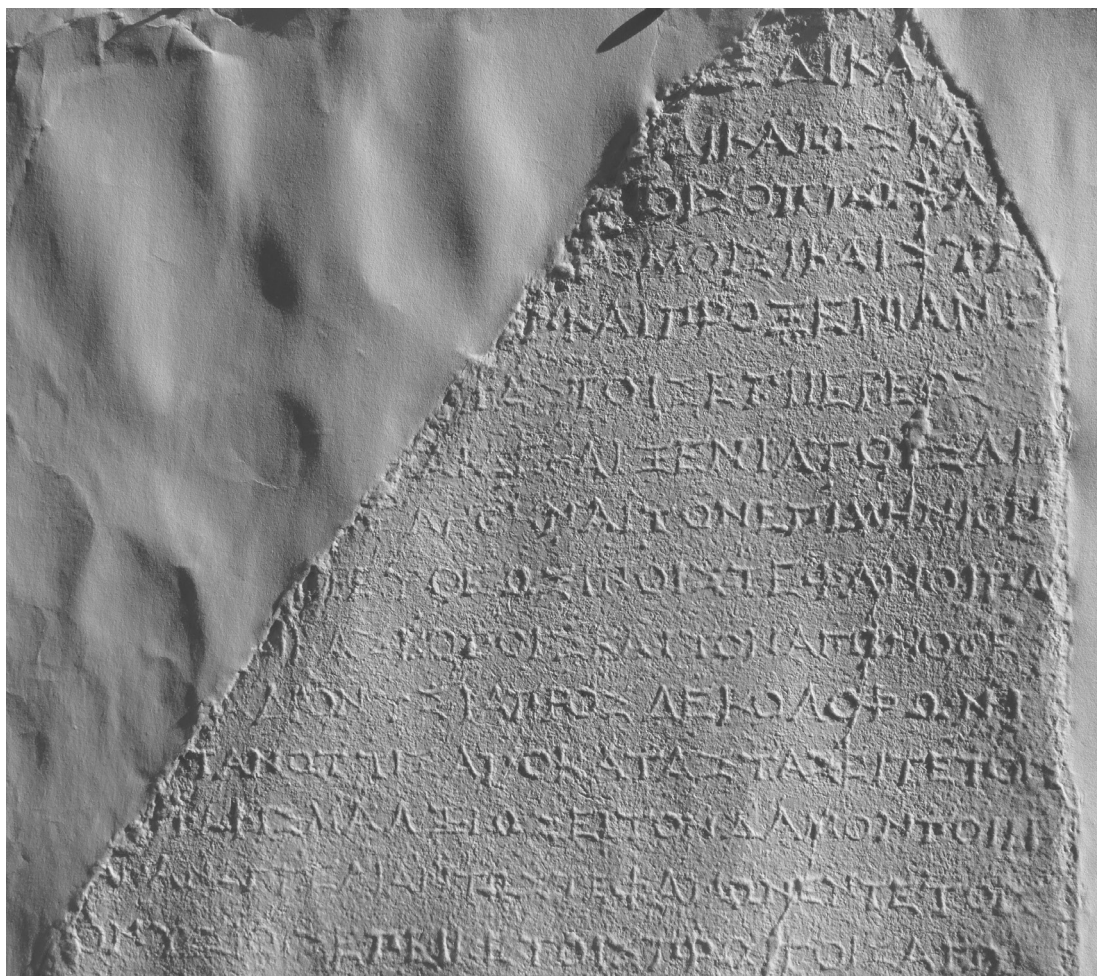
Figure 5 : ancien fragment, estampage des l. 1-15 (= 15-29 de l'ensemble).

L. 19 : P. Debord avait cru lire et avait transcrit un sigma isolé à la fin de la ligne. Sur l'estampage (fig. 5), on distingue trois hastes de ce qui devait plutôt être un epsilon (sans barre centrale), probablement gravé par erreur (voir le début de la l. 20). (P.F.)