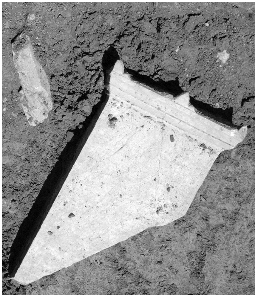
Figure1 : la stèle au moment de sa découverte en 2011.

entre citoyens. Ces décrets, ou plutôt l'échange de décrets généré par le succès de la mission des juges constituent une catégorie bien attestée à Colophon ou indirectement dans l'autre cité concernée, qu'elle ait reçu ou envoyé des juges 8 .