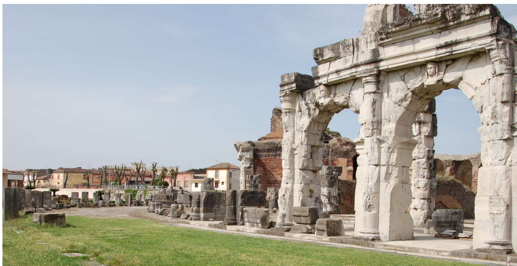
Fig. 2. Clefs de voûte de l'amphithéâtre de Capoue.