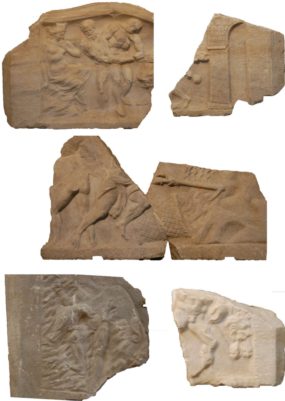
Fig. 6. Reliefs des vomitoires de l'amphithéâtre de Capoue mettant en scène la geste herculéenne.