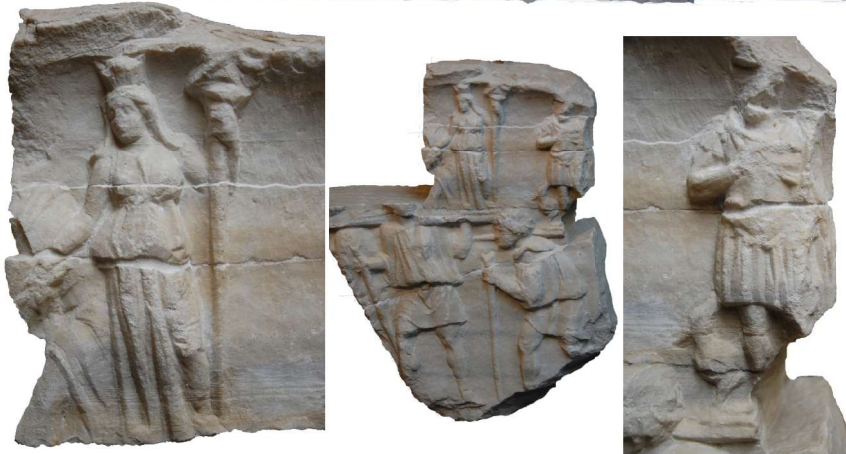
Reliefs de l'amphithéâtre de Capoue, c. 120-140 p.C.