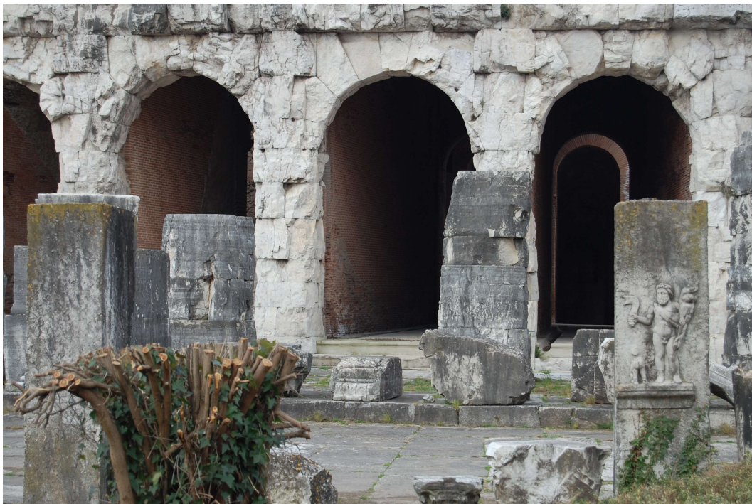
Fig. 3. Borne d'Hercule et Sylvain sur la platea de l'amphithéâtre de Capoue : (photographies : M. Soler).