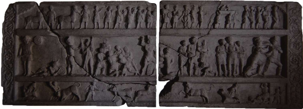
Relief funéraire de la nécropole maritime de Pompéi, c. 20-50 p.C.