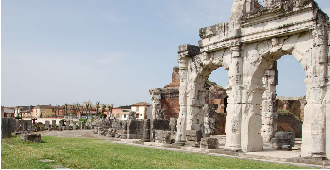
Fig. 2. Clefs de voûte de l'amphithéâtre de Capoue (photographies : M. Soler).