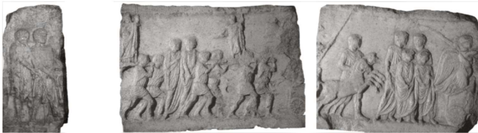
Relief funéraire d'un augustal d'Amiterne, c. 1-50 p.C.