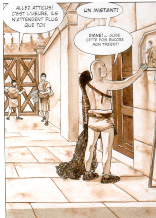
Fig. 4. Position du relief de Diane dans l'accès principal à l'arène de l'amphithéâtre d'Arles, scène imaginaire reconstituée (dans Arelate , III, pl. 38, dessin L. Sieurac).