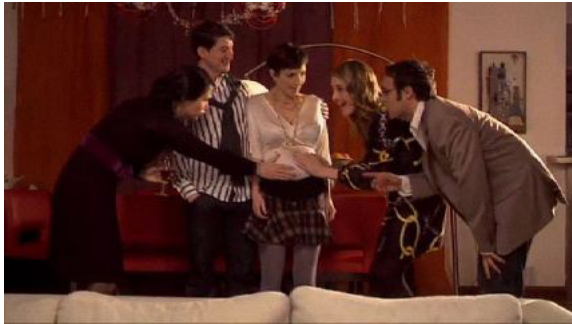
Vous les femmes, épisode 14, M6

Génée, Joëlle se laisse faire, puis se comporte en retour de la même manière. Elle s'approche alors de chacun et, tout comme elle a été touchée sans son consentement, fait de même : elle touche les seins de Géraldine puis les sexes d'Annabelle et de Luc, tout en reprenant les expressions mêmes utilisées par ces interlocuteurs : « c'est tout dur », « oh mais y'a de la vie, là », s'exclame-t-elle. Tous trois demeurent estomaqués, tandis que Joëlle sourit. Elle semble agir de façon à se faire accepter, c'est-à-dire en adoptant le même comportement que ses interlocuteurs. Si le fait de poser sa main sur un ventre rond est socialement acceptable dans la scène, le fait de toucher d'une manière similaire des corps « vides » ne l'est pas. Surprise, malaise et désapprobation sont dès lors lisibles sur les visages des autres personnages.