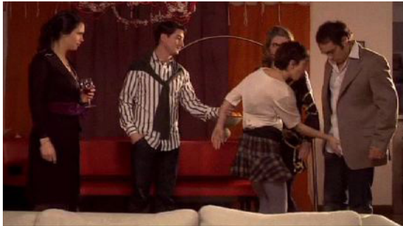
Vous les femmes , épisode 14, M6, photogrammes issus des archives de l'INA.

Les auteures ont choisi d'exagérer encore la situation puisque la femme touche des seins et des sexes mais il nous semble que l'important ne réside pas uniquement dans la partie du corps qui est touchée mais bien dans la transgression d'un contact corporel moins légitime socialement que le premier. L'attitude des personnages est poussée à son paroxysme bien sûr, mais reflète la réalité soulevée précédemment : le corps de la femme enceinte ne lui appartient plus. Le rapport au corps en est bouleversé, chaque personnage s'autorisant à toucher le corps enceinte et à vanter ses qualités. Il y a ici une parfaite dissociation entre la femme et le ventre contenant le fœtus. La saynète met l'accent sur l'infantilisation de la femme enceinte, et sur le fait que les personnages ne s'adressent guère à elle, mais à son ventre, et donc au bébé. Le contenu du ventre devient, en quelque sorte, prioritaire. La femme enceinte est réduite au stade de contenant, d'utérus. Cette saynète rend selon nous extrêmement lisible, en activant les ressorts de l'humour et de la dérision, la nécessité du consentement implicite de la femme enceinte vis-à-vis de comportements relevant de rapports de domination : il y a une véritable prise de pouvoir sur le corps de la femme enceinte qui d'emblée doit se soumettre à des gestes qui lui déplaisent.