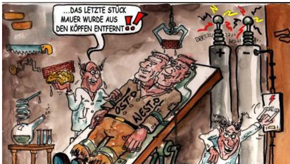
Figure 5 : Caricature de Horst Wendland, Augsburger Allgemeine , 3 octobre 2012 14