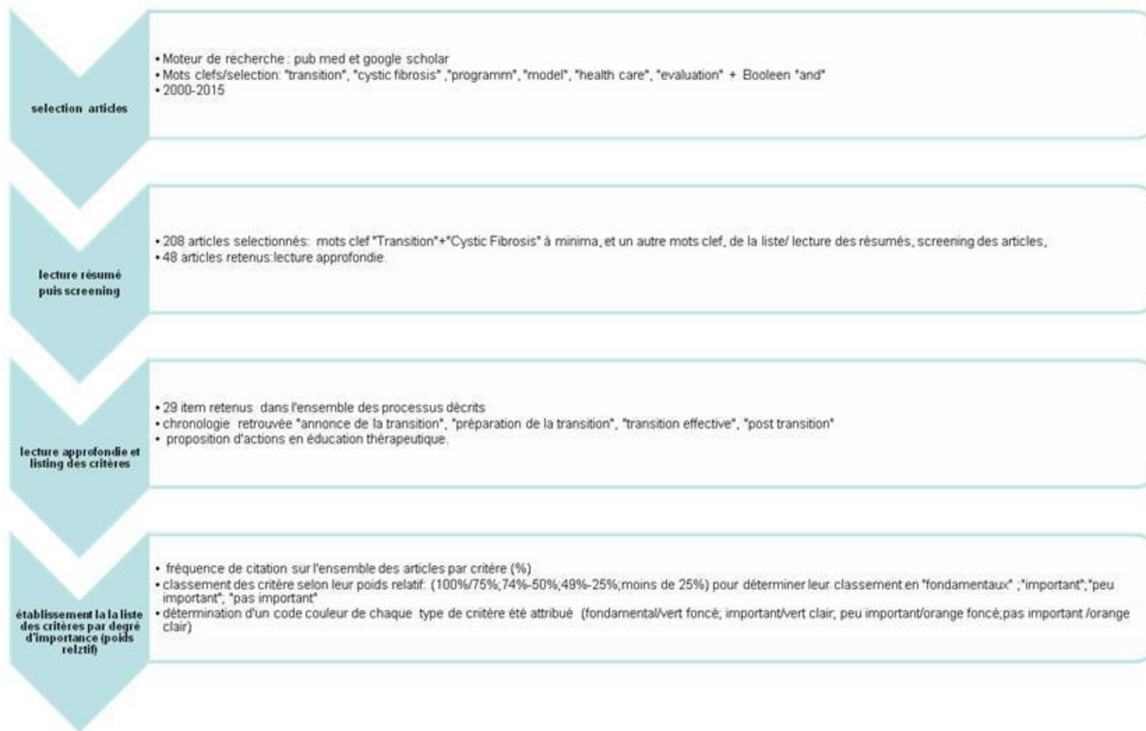
Figure 2: Méthodologie de sélection des critères de transition, dans la littérature traitant de la mucoviscidose