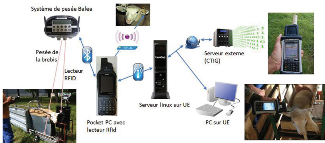
Figure 1. Schéma du principe de fonctionnement de la saisie portable.

Une application installée sur un PDA centralise les actions. Il peut être connecté en Bluetooth aux périphériques qui lui sont nécessaires. Les données collectées par le programme sont enregistrées par l'intermédiaire du Wi-Fi sur un serveur local ; une copie est aussi centralisée au CTIG (Centre de Traitement de l'Information Génétique) de l'Inra à Jouy-en-Josas afin d'optimiser leur sécurité et leur consultation. Comme les données ne sont plus stockées sur les PDA, on peut travailler avec plusieurs appareils en parallèle sur la même collecte. De plus, les échanges en cas de panne sont simplifiés. Dans les zones non couvertes par le Wi-Fi, les informations sont enregistrées directement sur le PDA, et déchargées ultérieurement sur un PC pour être centralisées dans la base de données.