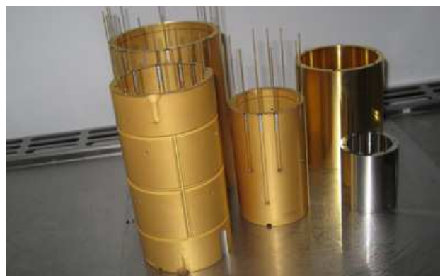
Figure 2.1 : Cœur mécanique du SUEP : cylindre en silice dorée pour les portes électrodes, masses d'épreuve (titane doré et platine)