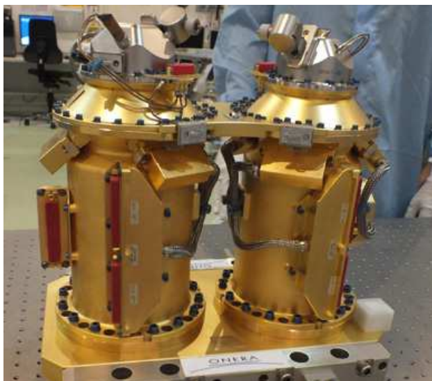
Figure 2.2 : Livraison du capteur électro-mécanique : charge utile T-SAGE 1 pour la mission MICROSCOPE

Chaque masse d'épreuve est entourée de tubes en silice dorée sur lesquels ont été gravées des électrodes permettant la mesure du mouvement des masses suivant ses 6 degrés de liberté par mesure capacitive. Sur ces mêmes électrodes, une électronique d'asservissement vient appliquer des tensions électriques pour maintenir les masses d'épreuve immobiles. La résolution de position est alors 10^{-12} m, soit 1% de la taille atomique, après une moyenne sur 720 000 secondes (120 orbites). L'amplitude des tensions appliquées est alors représentative de l'accélération.