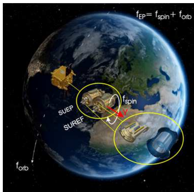
Figure 3 : Visual de la Terre, du satellite MICROSCOPE en orbite et des senseurs SUEP et SUREF.

Réaliser un test du principe d'équivalence à 10^{-15} signifie réaliser une mesure sur la différence d'accélération avec une précision de 7,9 \times 10^{-15} \text{ m/s}^2 .