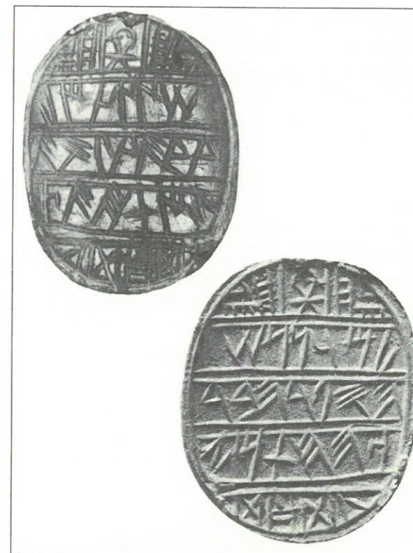
Figura 2 Sceau avec mention du nom d'un scribe (Cf. CSOSI, n° 38).

de travail typiques de tel ou tel métier, le rasoir du barbier, le poinçon du ciseleur, etc., aucune image ne semble renvoyer à la pratique de l'écriture dans l'iconographie du tophet. Tandis que l'Égypte a célébré la grandeur de ses scribes en leur dédiant des statues, dans le monde phénico-punique, on trouve à peine quelques amulettes en forme de palettes de scribe, selon un modèle du reste importé d'Égypte. On a donc la nette sensation que le scribe est tombé de son piédestal et est devenu un personnage comme les autres, très lointain descendant du mythique Taautos / Thot, sans plus guère de pouvoir magique ou surnaturel, une évolution qui reflète très certainement le processus de démocratisation, donc de banalisation de l'écriture. Cela dit, il faut introduire des nuances dans cette tendance générale: certains scribes, nous allons le voir, jouissent encore d'un réel prestige socio-culturel, peut-être même politique.