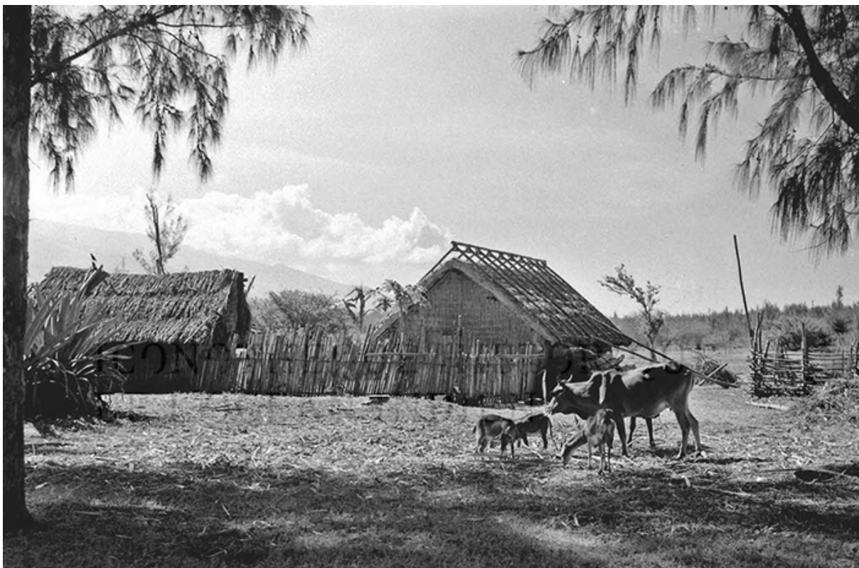
Figure 4. Un bœuf et quelques cabris, troupeau domestique. André Albany, Case de pêcheur sous les filaos à l'Hermitage les Bains, La Réunion, 1950, Iconothèque de l'océan Indien.

Il faut attendre 1804 et la mise en place de l'économie sucrière pour que l'ordonnancement sociospatial du versant - basé sur une volonté de rationaliser de façon zonale et étagée le système d'exploitation des ressources insulaires (Bonniol, Benoist, 1994) - prenne toute son ampleur. Au cœur de cette organisation domine l'étage de la canne à sucre, emblème de l'économie de plantation, avec ses usines et ses habitations coloniales dont les ravines font alors office de limites de propriétés. Les savanes s'étendent juste en dessous de l'étage de la canne. En marge des étages habités et cultivés, elles constituent les espaces où peuvent perdurer des pratiques d'élevage et s'épanouir des formes de liberté. Cette organisation du versant résiste jusqu'au milieu du XXe siècle, période d'expansion démographique et de mutations économiques et sociales, où s'étend l'habitat créole majoritairement basé sur un le modèle « case-cour » permettant plus ou moins l'autosubsistance de chaque famille. La kaz , ou maison, est ainsi quasi systématiquement accompagnée d'une kour , à la fois lieu de petites cultures potagères et fruitières et lieu de vie d'animaux domestiques (figure 4).