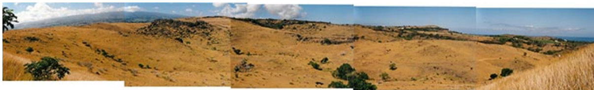
Figure 8. Vue de la ravine Boucan Canot dans la savane du cap La Houssaye, en 2002. La savane est alors principalement composée d'étendues plus ou moins homogènes d' Heteropogon contortus , avec quelques Pithecellobium dulce en fond de ravine.

ravines. La naturalisation rapide de l'espèce tend ainsi à annoncer sa prolifération immédiate hors des cours et des jardins. Loin d'avoir représenté une menace pour les écosystèmes et les paysages réunionnais, pendant de nombreuses années, cet « arbuste commun », pour reprendre l'expression de Cordemoy, s'est longtemps cantonné aux fonds et aux parois de ravines, aux espaces en friche ainsi qu'aux versants les plus escarpés du littoral ouest. Les nombreuses photographies réalisées dans les années 2000 montrent la quasi-absence du Leucaena dans les savanes, alors encore largement graminéennes et ouvertes, seulement arborées de quelques Pithecellobium dulce (figures 8 et 9). La progression est donc récente.