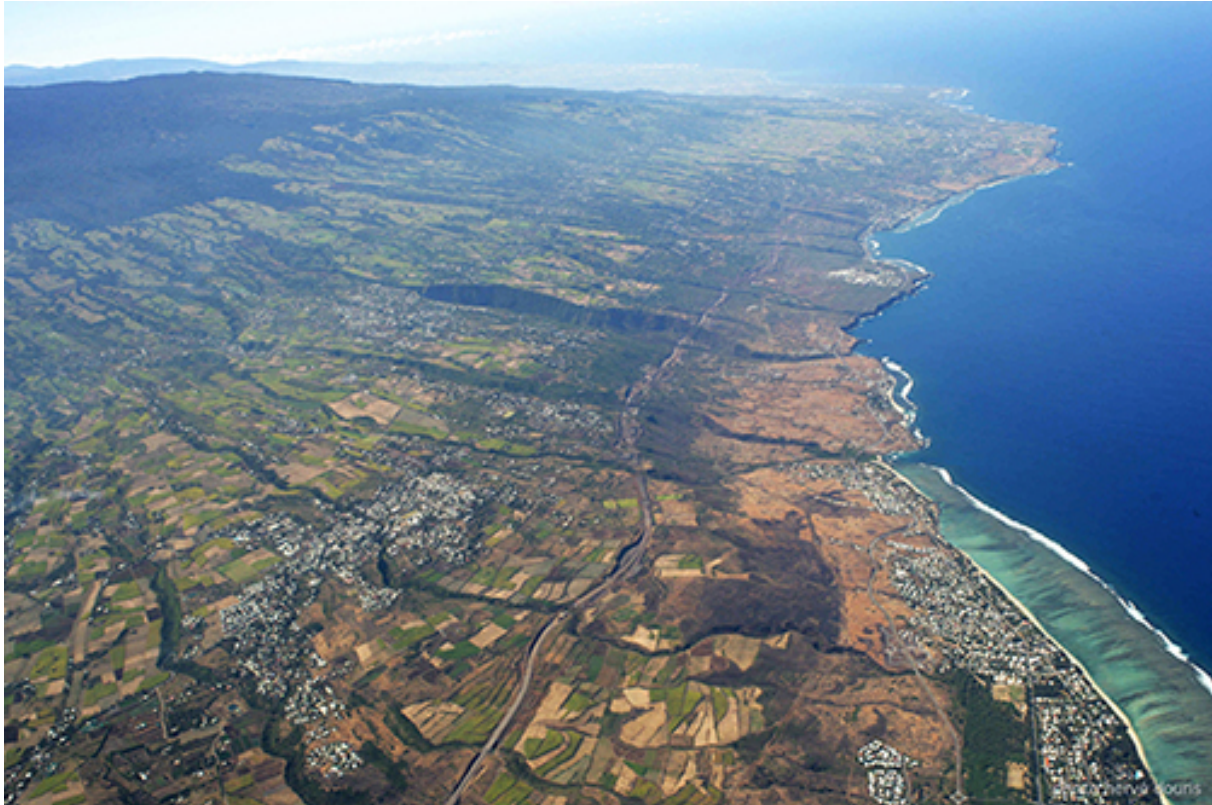
Figure 3. La côte ouest, de La Saline les Bains à Saint-Leu : une vue étagée du versant. Cette photographie illustre l'étagement du versant avec, d'aval en amont, le littoral, la bande côtière des savanes jaune fauve et les boisements bruns de fronts de coulées, l'étage de la canne « habitée » et son parcellaire en mosaïque, les pâturages de haute altitude et la forêt domaniale.

Dans ce paysage des Bas, le Leucaena leucocephala attire le regard. D'autres espèces rythment le paysage : le choka ( Furcea foetida ), avec ses « mâts » et ses feuilles de cire ; le tamarin de l'Inde ( Pithecellobium dulce ), le banoir ( Albizia lebbek ) ou le tamarinier ( Tamarindus indica ), grands arbres d'ombrage des savanes ; ou encore les vastes étendues herbeuses de graminées dont la plus commune, l' Heteropogon contortus , teinte la savane de jaune ocre en juin et de fauve en novembre. Mais le Leucaena leucocephala , qui abonde dans les savanes et dans les ravines jusqu'à la ligne des 400-600 mètres d'altitude, semble incarner les Bas de l'Ouest 5 .