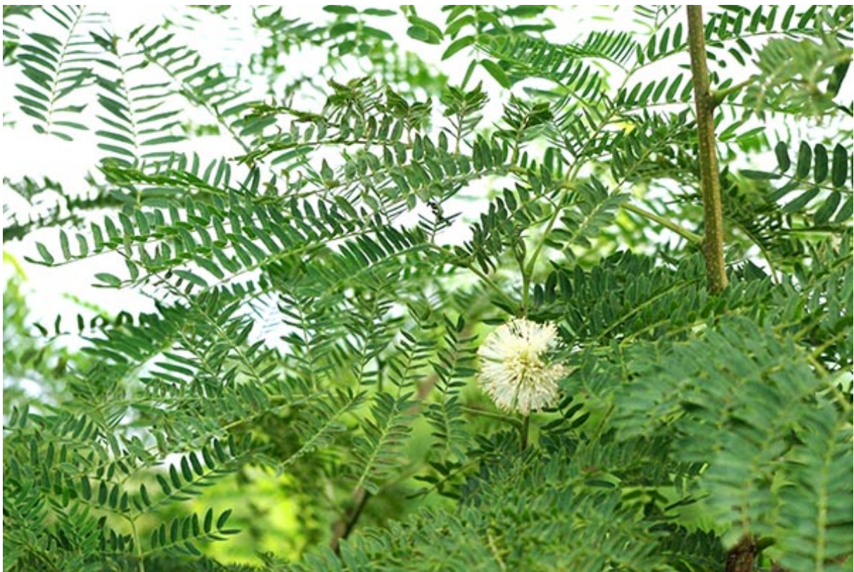
Figure 2. Fleur et feuilles de Leucaena leucocephala .

Les invasions biologiques, classées au niveau international par la Food and Agriculture Organisation of the United Nations (FAO) 4 comme la deuxième cause d'appauvrissement de la biodiversité juste après la destruction des habitats par la déforestation (Muller, 2000), sont des objets de lutte dans les Hauts sanctuarisés de La Réunion à l'image de la vigne marronne ( Rubus alceifolius ) ou de l'ajonc d'Europe ( Ulex europaeus ). Mais dans les Bas de l'Ouest, espaces considérés comme transformés et anthropisés, les questions du développement des plantes envahissantes et des changements paysagers et écologiques induits - fermeture des paysages et appauvrissement de la diversité floristique et faunistique notamment - ne constituent pas une priorité. Pourtant, l'enjeu est réel et clairement nommé. Parmi les espèces qui progressent, le Leucaena leucocephala , appelé généralement cassi ou mosa (figure 2), se montre particulièrement colonisateur (Lacoste, Picot, 2014).