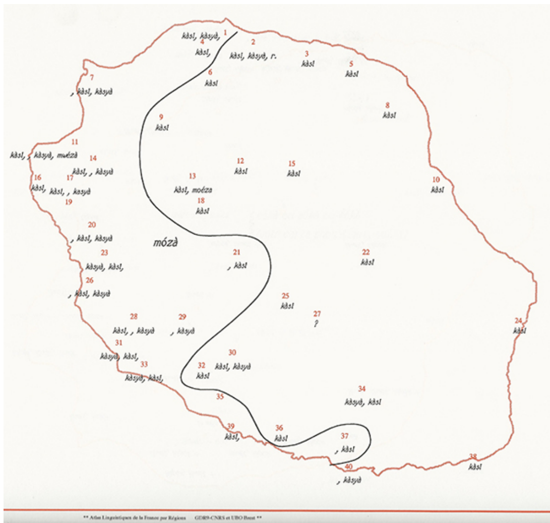
Figure 10. Noms créoles recensés pour dénommer le cassi. Carte extraite de l'Atlas linguistique et ethnographique de La Réunion, volume III, de Michel Carayol, Robert Chaudenson et Christian Barat, Paris, CNRS, 1995.