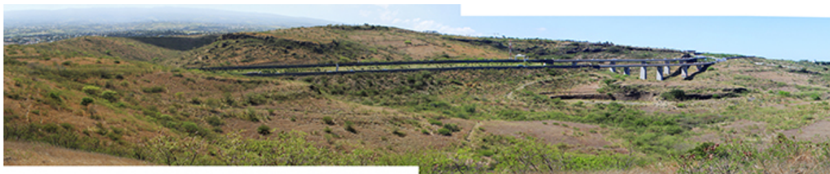
Figure 9. Reconduction photographique à partir du même point de vue en 2015 : on constate une nette progression de nappes arbustives principalement composées de Leucaena leucocephala .

L'analyse du corpus d'enquêtes confirme que cette espèce n'a pas toujours été une plante exotique ingérable. Au contraire, elle a été exploitée et presque « cultivée » par l'ensemble des habitants, durant plusieurs décennies. Ubiquiste, elle a longtemps constitué une ressource, spontanée devenue domestique, exploitable et très productive. De nombreux témoignages montrent l'ampleur de l'exploitation de l'espèce et son utilisation quasi quotidienne par les ménages, comme l'explique Jean-François, réunionnais créole de 55 ans : « Le cassi , cassia si tu veux, il était utilisé quand j'étais gosse comme fourrage. Beaucoup pour les lapins, beaucoup pour les cabris. Et comme il était utilisé en tant que fourrage, il n'y en avait pas partout, il était sous contrôle ! »