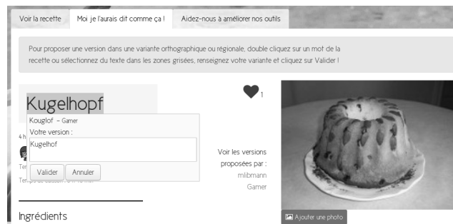
Figure 4. Ajout de la variante Kugelhof pour le mot Kugelhopf

Afin de construire un lexique de variantes alignées nous renseignant sur les mécanismes de variations à l'œuvre et pouvant être intégré à l'entraînement d'outils supervisés, nous avons mis en place l'interface « Moi je l'aurais dit comme ça ! » (voir la figure 4). Elle permet à tout participant d'ajouter une variété scripturale ou dialectale d'un mot d'une recette. Les participants ayant la possibilité de placer leur lieu d'apprentissage de l'alsacien sur une carte de l'Alsace découpée en cinq aires dialectales, nous envisageons par ailleurs d'utiliser cette fonctionnalité pour leur proposer les contenus existants dans la variété qu'ils préfèrent afin de faciliter leur participation (voir 3.5.4).