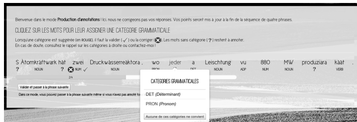
Figure 1. Interface d'annotation en parties du discours pour l'alsacien

Notre première expérience de production participative a concerné l'annotation en parties du discours : à travers une plateforme dédiée, le participant annote des séquences de quatre phrases (figure 1) dont une provient d'un corpus de référence annoté par des linguistes et sert à l'évaluation du participant 7 .