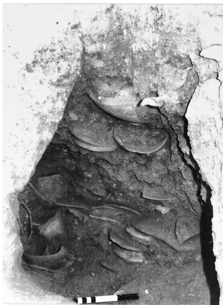
Fig. 8 — « Sanctuaire ». Coupe dans un bothros (Mission française de Kition et Salamine).