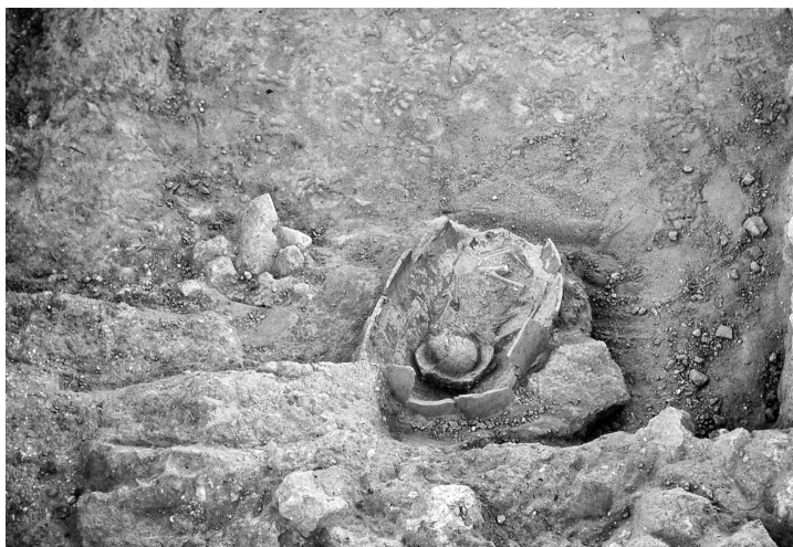
Fig. 3 — Fouilles de la ville : enchytrisme (Mission française de Kition et Salamine).

dernier usage de la tombe (et du remblaiement du dromos qui conduisait à la chambre). Si tel est bien le cas, les plus anciens enchytrismes de Cellarka pourraient dater du VI e s. av. J.-C. 17 . Il s'agirait alors d'une vraie rupture topographique : les dépouilles des très jeunes enfants (du moins de certains d'entre eux, car le nombre d'enchytrismes retrouvé, pour toutes les époques, est très réduit par rapport au taux probable de la mortalité infantile) ont quitté l'espace de la ville pour intégrer celui, périurbain, des nécropoles. Quand ce déplacement a-t-il eu lieu ? Les découvertes de Cellarka fournissent un terminus ante quem , elles ne permettent toutefois pas de combler le hiatus de la documentation entre le IX e et le VI e s.