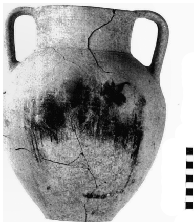
Fig. 7 — « Sanctuaire ». Amphore culinaire de type égéen, datable des XI e - X e s. av. J.-C., Sal. 7230 (Mission française de Kition et Salamine).

qualifier de monumental, mais du moins d'une qualité de construction soignée.