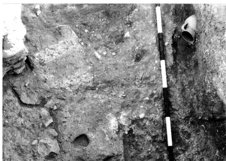
Fig. 6 — « Sanctuaire ». Sol géométrique avec empreinte de dallage et amphore culinaire (Sal. 7230) en place (Mission française de Kition et Salamine).