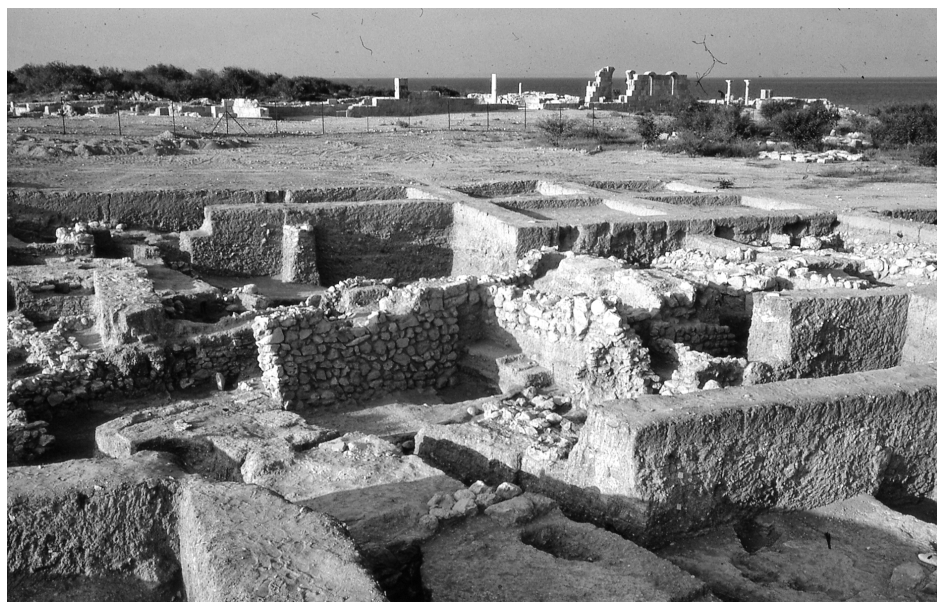
Fig. 5 — Vue générale de la fouille du « sanctuaire » vers le nord-est. « Autel » de brique et « mur-écran » (Mission française de Kition et Salamine).

Les limites de l'ensemble sont difficiles à cerner. Un long mur nord-sud, qui passe dans le carré K V/η 5, constituerait la limite orientale du sanctuaire aux époques géométrique et archaïque. Au nord-est, l'édifice serait bordé par une grande cour. Mais