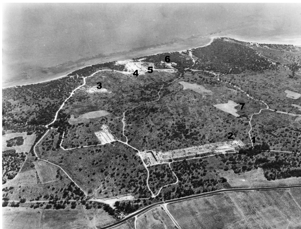
Fig. 2 — Photographie aérienne du site de la ville vers l'est, prise dans les années 1960 (Mission française de Kition et Salamine). 1 : Tombe I ; 2 : Temple de Zeus ; 3 : Résidence byzantine dite « l'huilerie » ; 4 : Basilique de la Campanopétria ; 5 : « Sanctuaire » ; 6 : Rempart ; 7 : Daimonostasion.

en cours de dégagement en 1974 : il a été interprété comme un sanctuaire géométrique et archaïque. Il était adossé à un rempart qui suivait la ligne de crête. Seize volumes ont paru dans la série Salamine de Chypre (1969-2004) : catalogues par catégorie d'objets, corpus de textes et études de monuments. Les archives primaires de la fouille française de Salamine (carnets, inventaires, relevés, dessins, photographies, diapositives), qui sont conservées à la Maison de l'Orient, à Lyon, constituent une documentation, en partie inédite, qui est en cours de numérisation 3 . Or, la numérisation offre des possibilités d'exploitation des archives selon des perspectives nouvelles, des questionnements autres que ceux qui ont présidé à leur constitution. Elle permet notamment de replacer les objets dans leur contexte original de découverte, de rompre les catégories typologiques