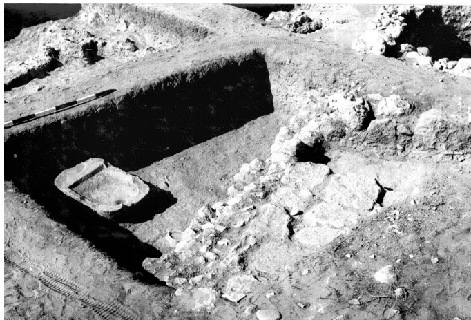
Fig. 9 — « Sanctuaire ». Vasque Sal. 7250 en place sur un sol archaïque (Mission française de Kition et Salamine).

Des marqueurs urbains autorisent à qualifier de ville l'établissement de Salamine, dès les premiers niveaux géométriques. En