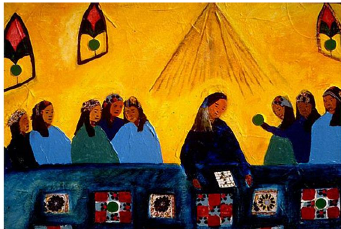
Exposition des œuvres de Sheila Orr, Sex quills and Rock'n roll et The Last Bingo. Piquants de porc-épic, collages, acrylique