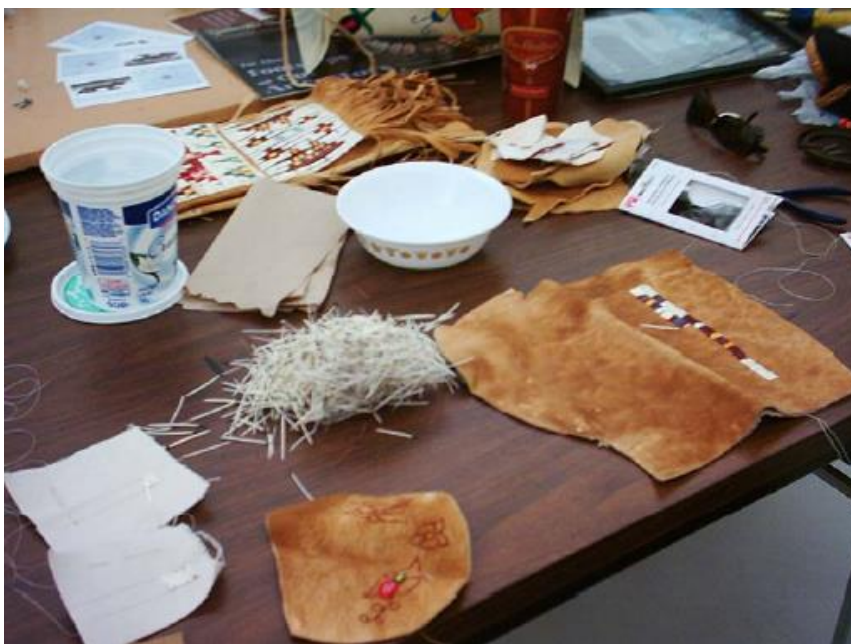
Atelier de broderie

Jainie est donc devenue « une femme bien », mais grâce à un apprentissage à la fois incongru, avec un homme, et qui plus est, ni son père, ni son grand-père mais aussi contre toute attente dans un schéma finalement assez traditionnel, par un « oncle » d'adoption. L'adoption dans les sociétés amérindiennes est en effet d'usage fréquent, j'ai moi-même été « adoptée » lors de mon terrain par une famille, ce qui a constitué une porte d'entrée majeure de mon acceptation. L'adoption revêt une signification spirituelle et sociale, qui permet la circulation et le partage des responsabilités et connaissances, notamment dans le domaine rituel.