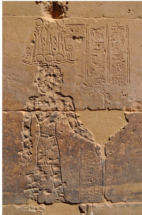
Fig. 2 — Représentation divine martelée sur un des murs du temple de Philae (photo : J.H.F. Dijkstra).