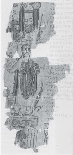
Fig. 1 — Illustration de l'« Alexandrian World Chronicle » (Ve-VIe s.), Moscou, Musée Pushkin, inv. 3108/, verso (photo tirée d'A. Bauer & J. Strzygowski, Eine alexandrinische Weltchronik. Text und Miniaturen eines griechischen Papyrus der Sammlung W. Goleniščev, Vienne, 1905, pl. VI verso, détail ).