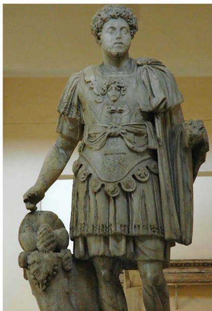
Fig. 5 — Croix ajoutée sur le bas de la cuirasse (après martelage) d'une statue de Marc-Aurèle (Musée Gréco-Romain, Alexandrie).