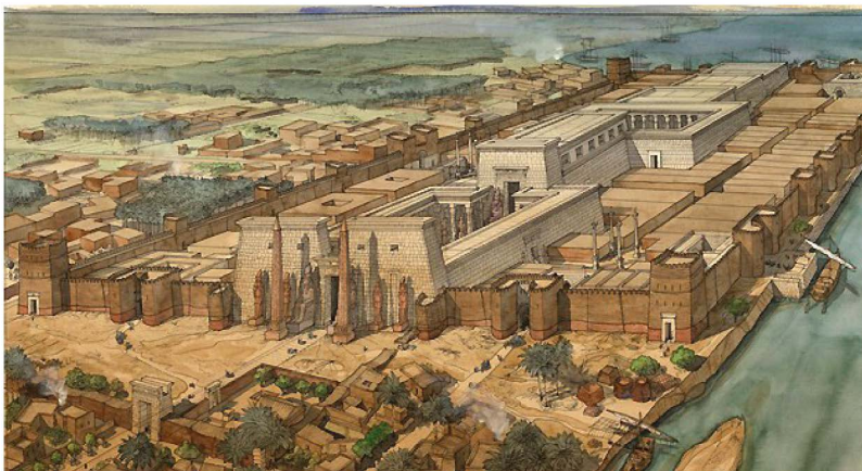
Fig. 3 — Reconstitution du camp militaire de Louqsor (aquarelle : J.-C. Golvin © Éditions Errance).