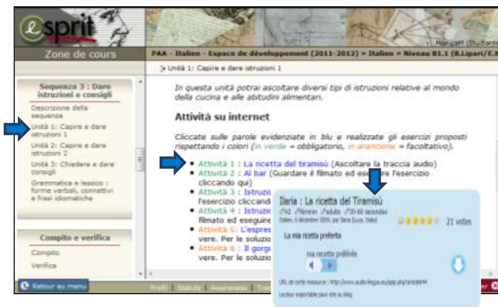
Figure 3 - L'activité « La ricetta del tiramisù » du parcours B1.1

Au niveau de l'éveil métacognitif préconisé (cf. 1.1), le plus grand soin a été accordé aux intitulés des unités, explicitant les objectifs poursuivis et les compétences mobilisées, afin de conduire les utilisateurs à un usage conscient et productif des matériaux d'apprentissage.