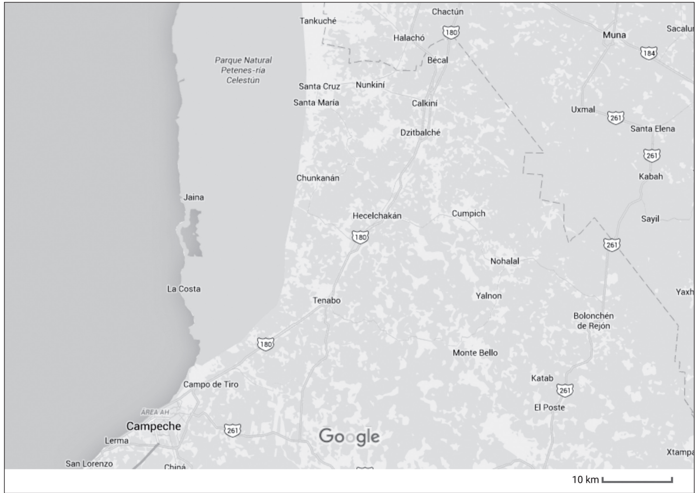
Mapa de la zona con los principales pueblos