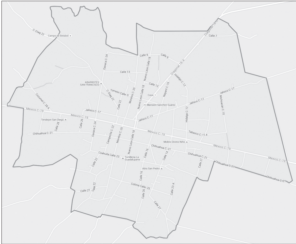
Mapa de Nunkini

Nunkini es un pueblo con alrededor de 8000 habitantes ubicado en la frontera de los estados mexicanos de Campeche y Yucatán, pero localizado en Campeche. El idioma principal es el maya yucateco y la población en su gran mayoría es católica y de cultura maya, aun cuando la forma de vivir cambio mucho en las últimas décadas. El pueblo está muy bien relacionado con el mundo exterior: varias conexiones al día con Mérida y Campeche, y cada media hora con Calkini, la cabecera regional. El Patrón del pueblo es san Diego de Alcalá, un santo franciscano del siglo XV. San Diego es festejado dos veces al año, en abril y noviembre. Esas fiestas se terminan con una ceremonia muy original –creo que sólo existe en Nunkini–, la quema del caballero de fuego o Dzulik'aak' . El libro de los bakab , el más importante de los manuscritos coloniales, fue probablemente escrito en Nunkini a finales del siglo XVIII.