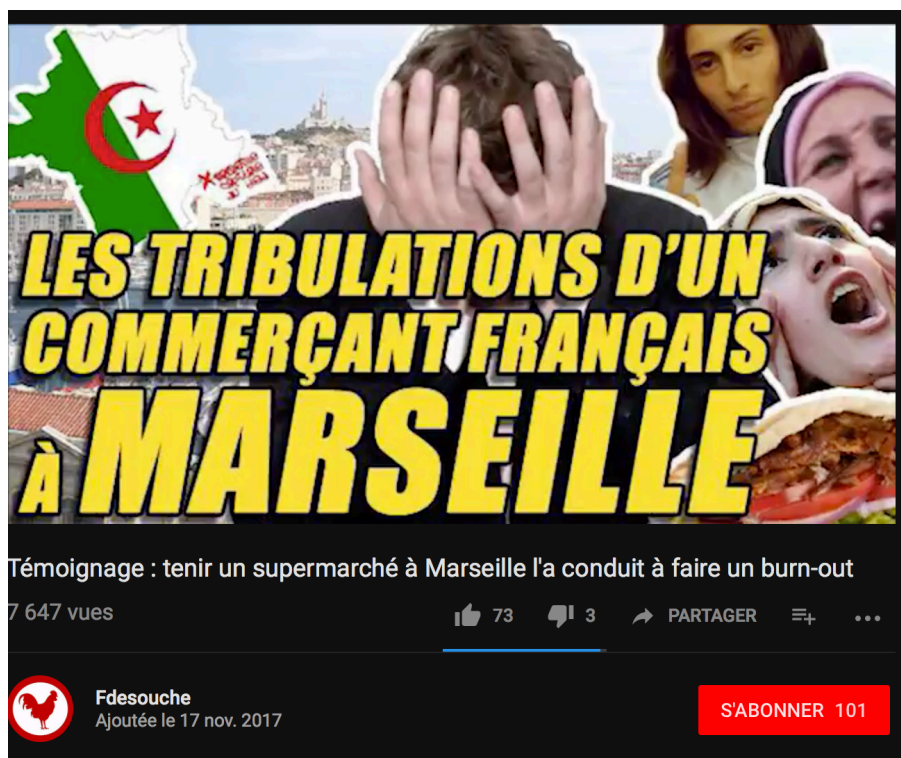
Figure 4 : Vidéo de Fdesouche du 17 novembre 2017. 15

Cette association de l'image et des mots, avant même d'avoir écouté l'enregistrement audio, crée une représentation mentale : « (...) paradoxalement, le monde de l'image est dominé par les mots. (...) Et les mots peuvent faire des ravages : islam, islamique, islamiste - le foulard est-il islamique ou islamiste? Et s'il s'agissait simplement d'un fichu, sans plus? (...) Parce que ces mots font des choses, créent des fantômes, des peurs, des phobies ou, simplement, des représentations fausses. » (Bourdieu, 1996, 18-19).