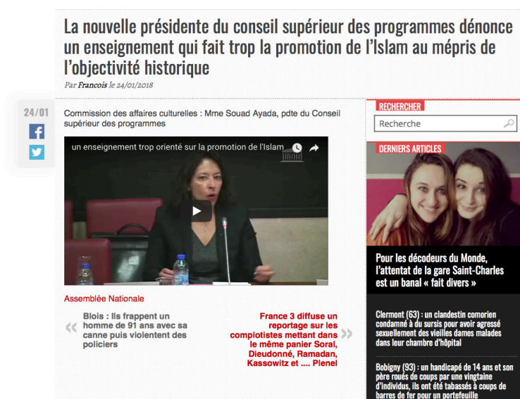
Figure 3 : Une vidéo de l'assemblée nationale coupée par Fdesouche datée du 24 janvier 2018. 10

C'est le cas notamment avec une vidéo de l'Assemblée nationale du 24 janvier 2018 : « La nouvelle présidente du conseil supérieur des programmes dénonce un enseignement qui fait trop la promotion de l'Islam au mépris de l'objectivité historique » 11 . Il ne s'agit en aucun cas de fake-news car la vidéo initiale a été publiée par l'Assemblée nationale. Celle-ci a une durée de deux heures dix-neuf minutes tandis que celle de Fdesouche dure une minute vingt-cinq. En apparence, la vidéo est utilisée à la manière d'un fait brut sans analyse, ni explication. Un fait brut qui a toujours les mêmes thèmes : « Le « fait brut » porte généralement sur l'immigration, l'insécurité, la crise de l'éducation. » (Huyghe, 2016, 162). La construction intervient à partir du moment où il y a un montage, un choix de séquence. Cette pratique est tout à fait utilisée par les médias traditionnels notamment dans la manière dont les journalistes donnent un angle à leurs reportages. Cependant le