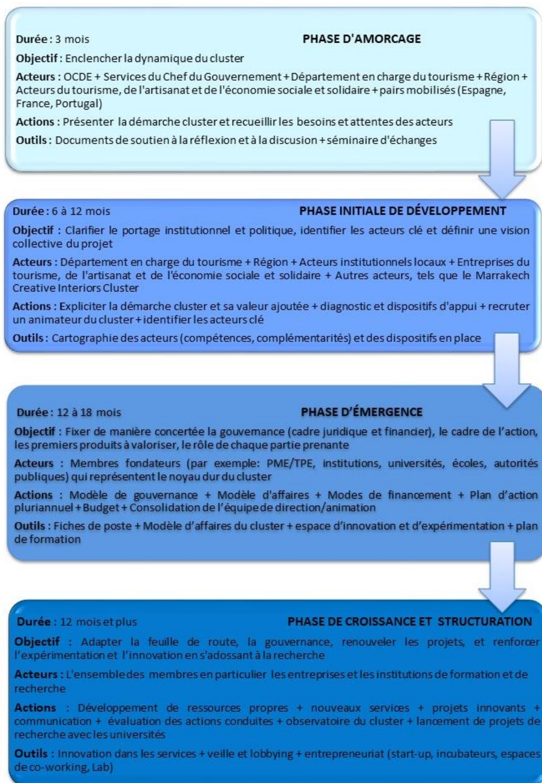
Graphique 5. Schéma séquentiel pour la mise en place du cluster tourisme « Art de Vivre marocain »