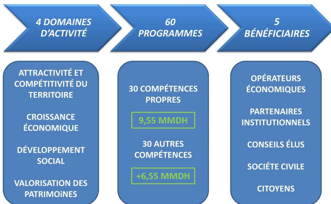
Graphique 4. Axes structurants du programme de développement régional de Marrakech-Safi