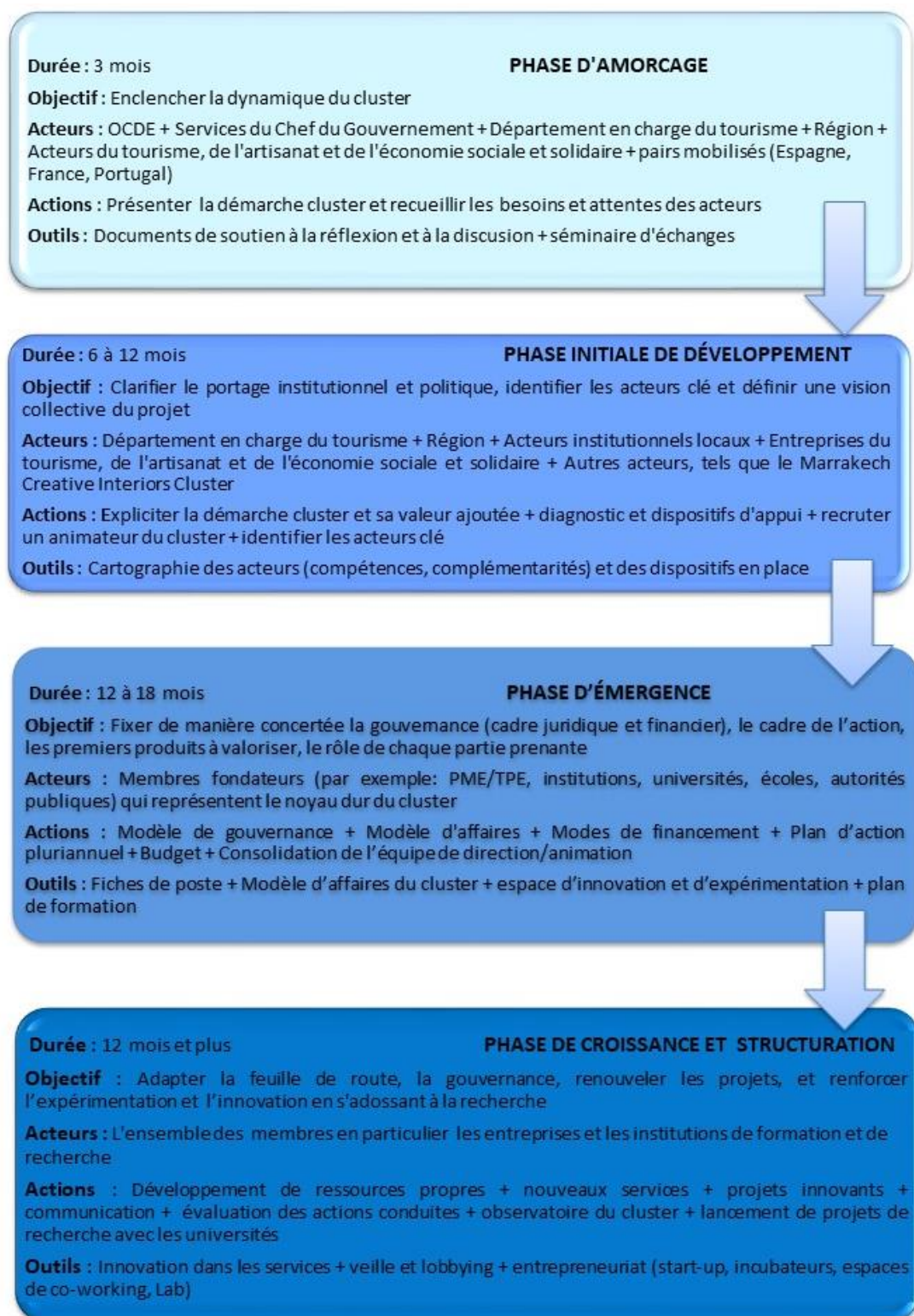
Graphique 5. Schéma séquentiel pour la mise en place du cluster tourisme « Art de Vivre marocain »