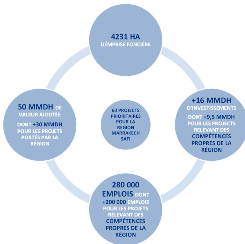
Graphique 3. Priorités du programme de développement régional de Marrakech-Safi