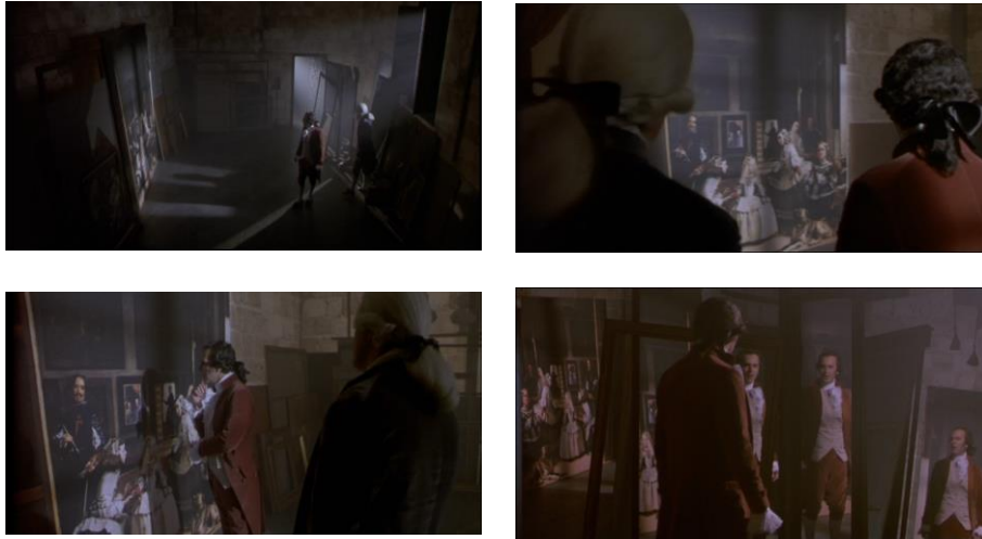
Fig. 1 – Goya et Bayeu au Palais royal – Les Ménines (séquence 29, 01:20:41 ; 01:20:54 ; 01:21:36 et 01:22:53)