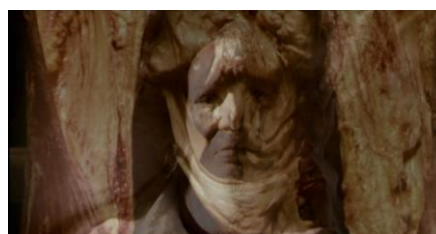
Fig. 8b – Le bœuf écorché et le portrait de Goya (séquence 1, 00:03:17 ; 00:03:34 ; 00:03:42 et 00:03:49)