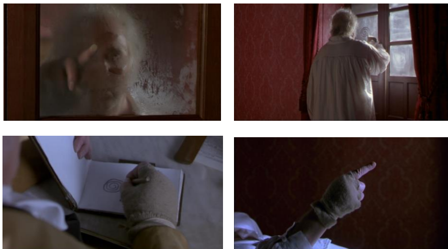
Fig. 9 – « La espiral es como la vida » (00:04:52 ; 00:05:05 ; 00:52:29 et 01:33:26)

entre saturation et dissémination du sens, étant finalement pris dans un tourbillon dont la circonférence est partout et le centre nulle part (fig. 9).