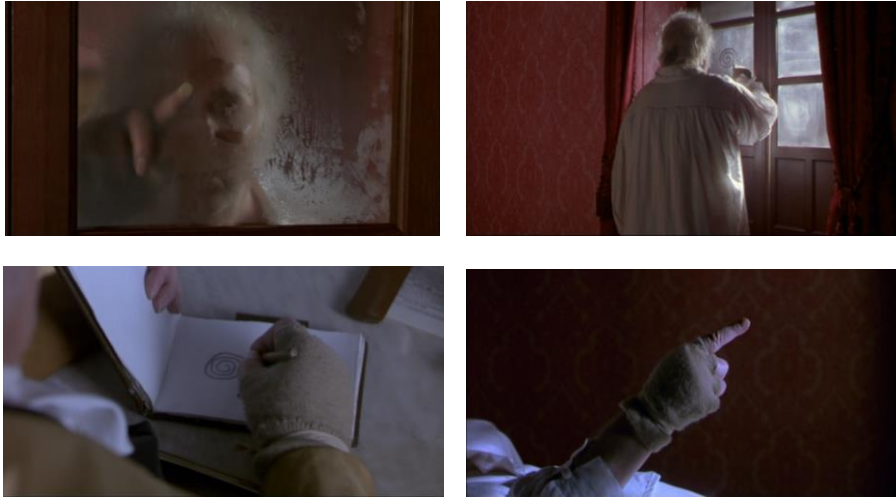
Fig. 9 – « La espiral es como la vida » (00:04:52 ; 00:05:05 ; 00:52:29 et 01:33:26)

entre saturation et dissémination du sens, étant finalement pris dans un tourbillon dont la circonférence est partout et le centre nulle part (fig. 9).