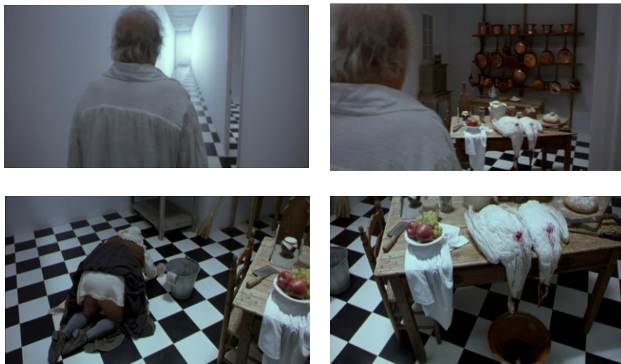
Fig. 3 – Couloir de Goya (séquence 2, 00:06:36) et Scène de cuisine (séquence 2, 00:06:44 ; 00:06:55 et 00:06:57)