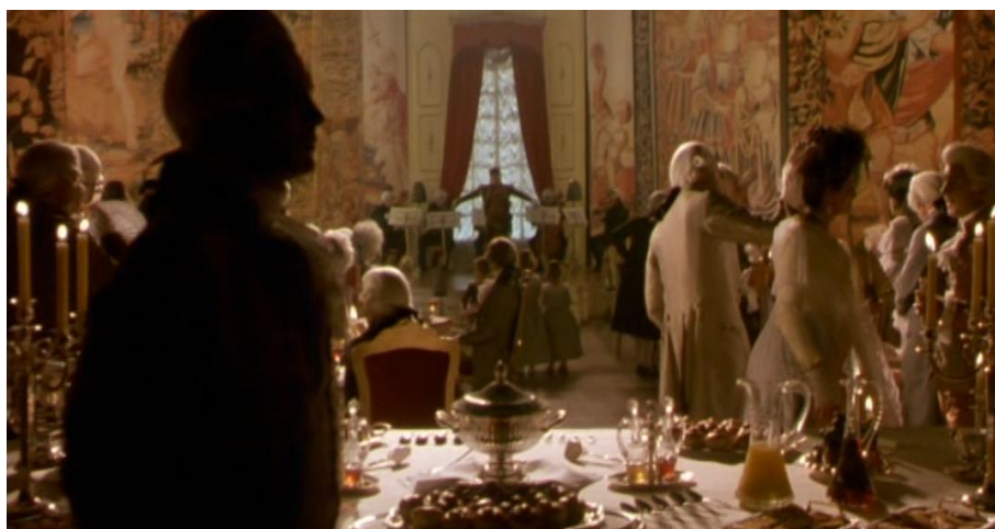
Fig. 4 – Le salon des Ducs d'Osuna (séquence 5, 00'14'23)