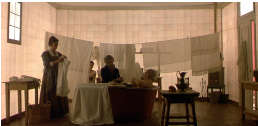
Fig. 6 – Le bain de Goya (séquence 4, 00’10’31)