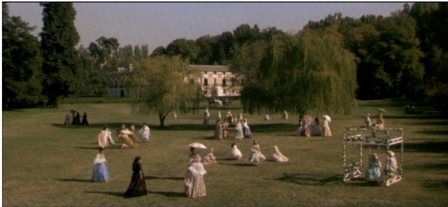
Fig. 5 – Les jardins d’Aranjuez (séquence 27, 01:14:22 et 01:14:31)