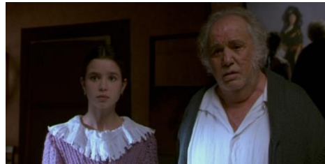
Fig. 2a – Goya et Rosarito dans le miroir de l'art (séquence 22, 01:06:55)