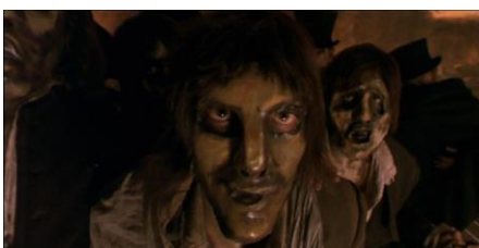
Fig. 7 – Les Peintures Noires (Séquence 17, 00:48:12; 00:50:08 et 00:50:15)