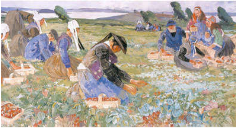
Cueillette des Fraises (1942), de Mathurin Méheut (Plougastel, Musée de la Fraise et du Patrimoine).

Lorsque les cultures fruitières, et notamment celle des pommiers, atteint les strates populaires, celles-ci développent leurs propres recettes pour conserver les fruits. Point besoin de sucre, si ce n'est le propre sucre des fruits, et une cuisson très longue. En pays gallo par exemple, les quartiers de pommes sont cuits dans du jus de pomme pendant toute une journée, jusqu'à donner un sorte de pâte caramélisée qui se conserve des années, et que l'on nomme le pommé. D'après Sébillot (1886), « le pommé est une sorte de confiture qui, en certains cas, remplace le beurre. Souvent, dans les fermes, on sert à la fois le pot à pommé et l'assiette au beurre. Mais ce sont surtout les enfants de l'école qui en emportent pour en étendre sur leur pain ». Considéré comme le « beurre du pauvre » pendant la guerre, comme l'indique l'Inventaire du patrimoine culinaire de Bretagne (1994), ce n'est que bien plus tard qu'il sera reconnu et apprécié comme spécialité locale. Des recettes similaires existent à base de poires, ou encore de cerises 1 .