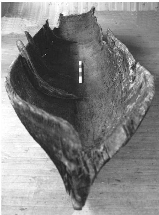
Figura 3. Canoa Monóxila extraída del río Maullín. Colección Museo Municipal de Maullín.

también se requiere un gran conocimiento de los materiales de construcción de las embarcaciones, tanto de las maderas como de las herramientas utilizadas en su manufactura. De esta forma podemos darnos cuenta que estas poblaciones poseen una alta especialización en ciertos aspectos y un profundo conocimiento de su medio ambiente.