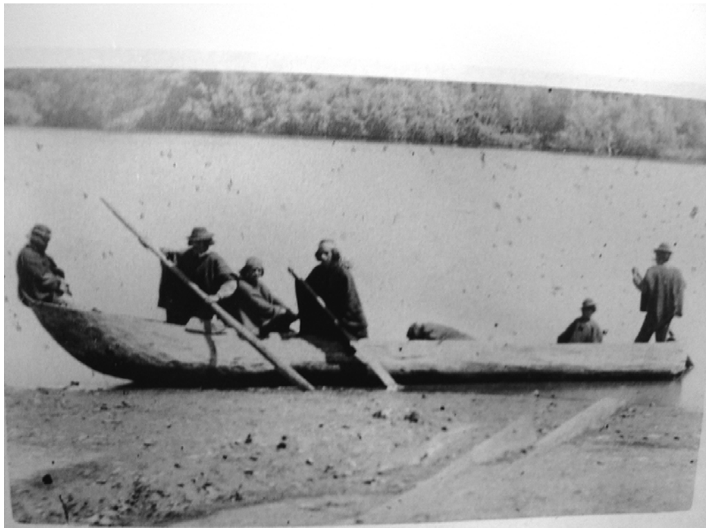
Figura 2. Canoa mapuche orillada con sus ocupantes en el interior. Tomada por el fotógrafo Valck de Valdivia en 1870. Colección Particular de Álvaro Besa.

Los indios que están en medio de él mar, en las islas de Santa María y la Mocha, con estas ligeras embarcaciones magüei atrabiesan el mar y van y vienen a tierra firme con sus casas y bastimentos, y en ellas pasan sus ganados, caballos, atados de pies y manos, y bueyes y bacas, sin hacer caso de las hondas del mar, aunque a los indios de la Mocha, por ser aquel mar proceloso, les ha costado muchas vidas el despreciar sus hondas y no aguardar a tiempo más sereno. (Rosales:172)