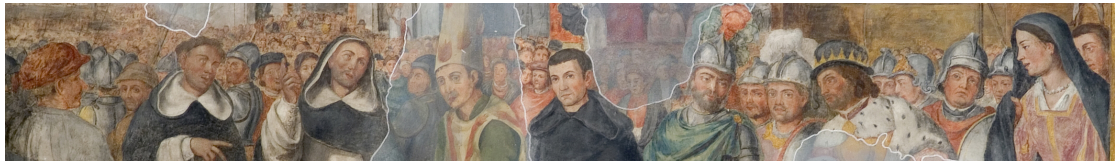
L. Valdés. Fresque de l'église de la Madeleine, Séville. Détail.