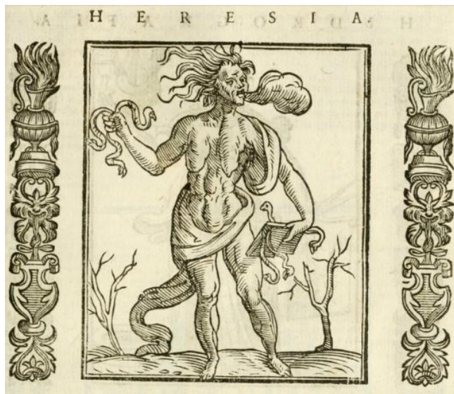
Ilustración 1: Representación de la Herejía, según la Iconología de Cesare Ripa (edición de 1613). Dominio público.

útil no solo para los creadores de jeroglíficos e imágenes simbólicas sino también para la población de media y alta cultura que participaba de los juegos intelectuales que este tipo de representaciones le permitía. Así pues, formaría parte de la cultura visual que una parte de la población poseería a la hora de identificar tal concepto en las artes efímeras y así aparece representada en