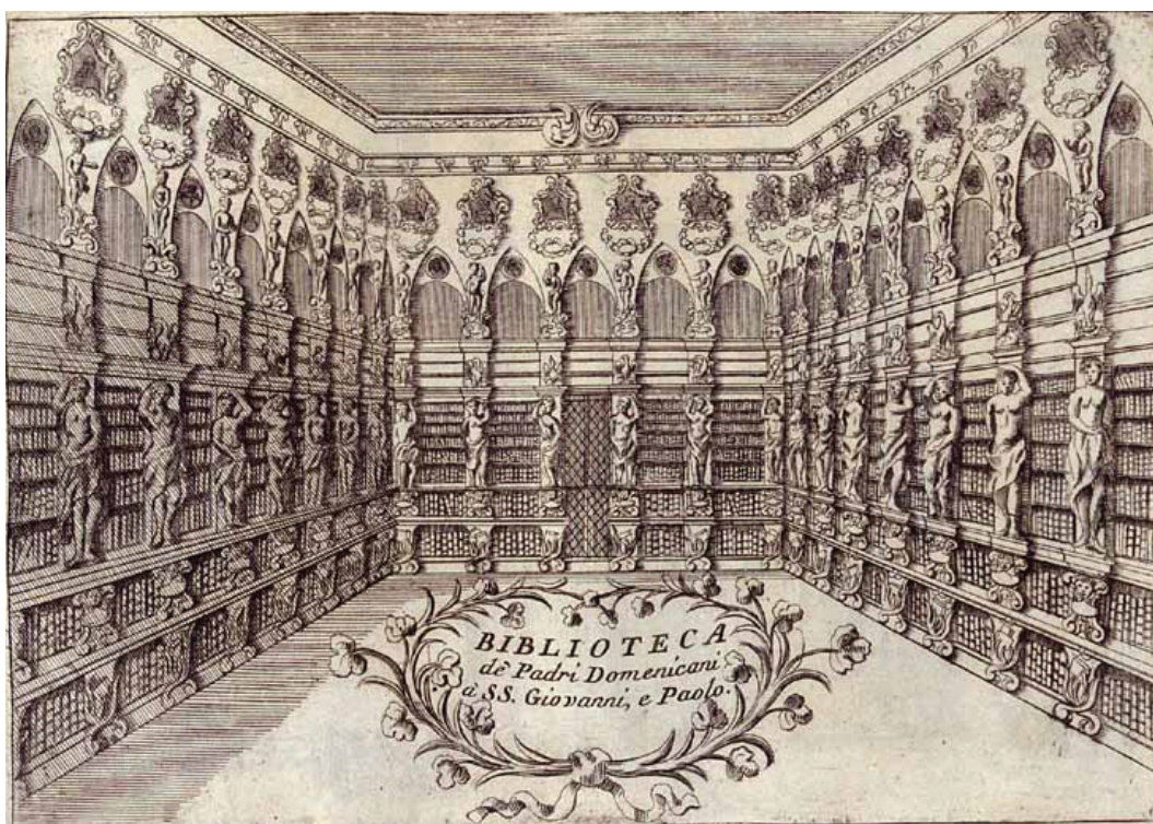
Ilustración 2: Biblioteca de San Giovanni e Paolo de Venecia, lámina 88 de Coronelli, 1710.

Desgraciadamente, toda la parte inferior está hoy en paradero desconocido y dependemos de las descripciones antiguas. En 1807, con la supresión del convento según las ordenanzas napoleónicas, se ordenó la retirada y venta de los elementos verticales de la biblioteca 42