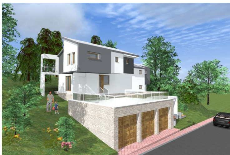
Figure 1 - Maquette 3D du cas d'étude. Maison Passive située en Bulgarie

Dans un premier temps les fonctions objectifs choisies pour l'optimisation sont les suivantes : la minimisation du bilan annuel net d'électricité (la consommation énergétique n'est constituée que d'électricité) et la minimisation du coût d'investissement. Des données météo bulgares de l'année 1995 sont utilisées et la course du soleil est simulée pour les coordonnées géographiques réelles du bâtiment. Le modèle est divisé en quatre zones dont deux zones chauffées : une zone « Jour » chauffée à une température moyenne de 20,3°C et une zone « Nuit » chauffée à une température moyenne de 19,6°C. Les scénarios de consigne de température, d'occupation, de consommation d'ECS et d'électricité spécifique sont générés par un modèle stochastique d'occupation développé par Vorger (2014) et implémenté dans le logiciel Amapola . Le modèle a été calibré sur les données de l'Enquête Emploi du Temps de l'INSEE 2 et génère des scénarios d'usages détaillés et réalistes. L'occupation est considérée pour une famille de quatre personnes.