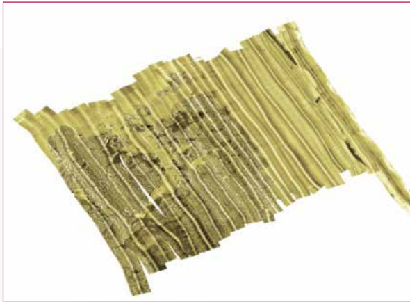
Fig. 4 - Mosaicatura dei sonogrammi Side Scan Sonar

continuo del Bene, nella sua protezione contro le modifiche ambientali, nella sua difesa contro il saccheggio operato da organizzazioni criminali e, come detto, nella sua fruizione. I vantaggi di lavorare con uno sciame, rispetto al singolo robot sono i seguenti [5]: