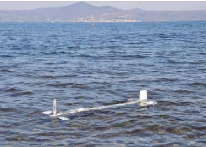
Fig. 1 - Prototipo in sperimentazione nel lago di Bracciano.

Di Ramiro Dell'Erba, Claudio Moriconi, Alfredo Trocciola