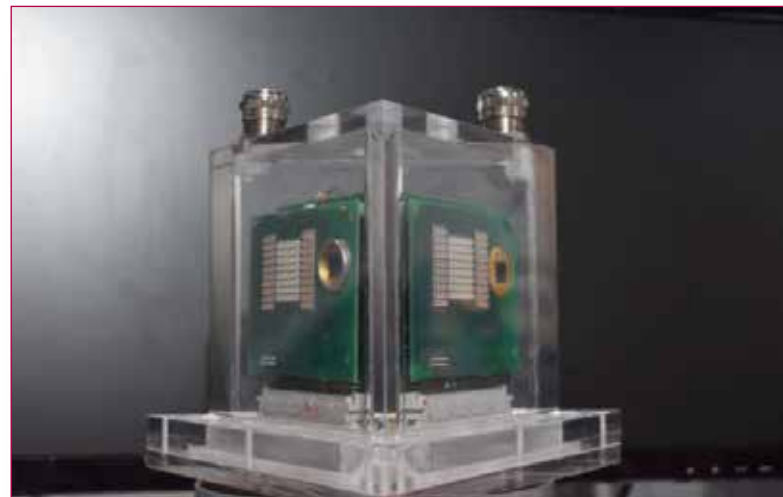
Fig. 3 - Prototipo di modem ottico realizzato dal Laboratorio di Robotica dell' ENEA.

Un nuovo modo di proteggere e fruire dei Beni Culturali siti in ambienti sottomarini, di cui il nostro Paese è ricchissimo, riguarda la Robotica di Sciame. In essa un gruppo organizzato (dell'Erba et al. 2008) di AUV economici, di piccole dimensioni (MAUV) ed equipaggiati con una sensoristica minima e videocamere sono in grado di esplorare grandi aree marine simultaneamente, aumentando la probabilità di scoperta. Gli sciame però intervengono anche nel monitoraggio