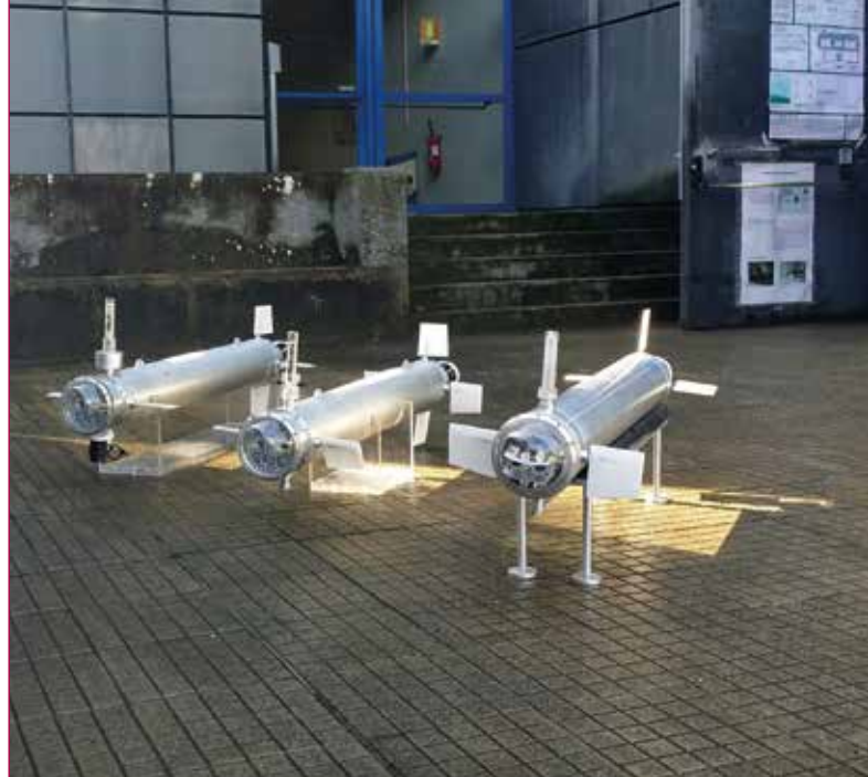
Fig. 2 - Prototipi di MAUV.

I robot impiegabili in ambiente subacqueo sono di diverso tipo dai ROV, AUV, Glider etc...ognuno di essi presenta dei