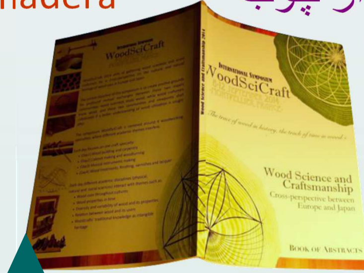
Actes du 1er Symposium WoodSciCraft

legno 木材 bois dřevo hout wood lignum les fusta madera Holz از چوب