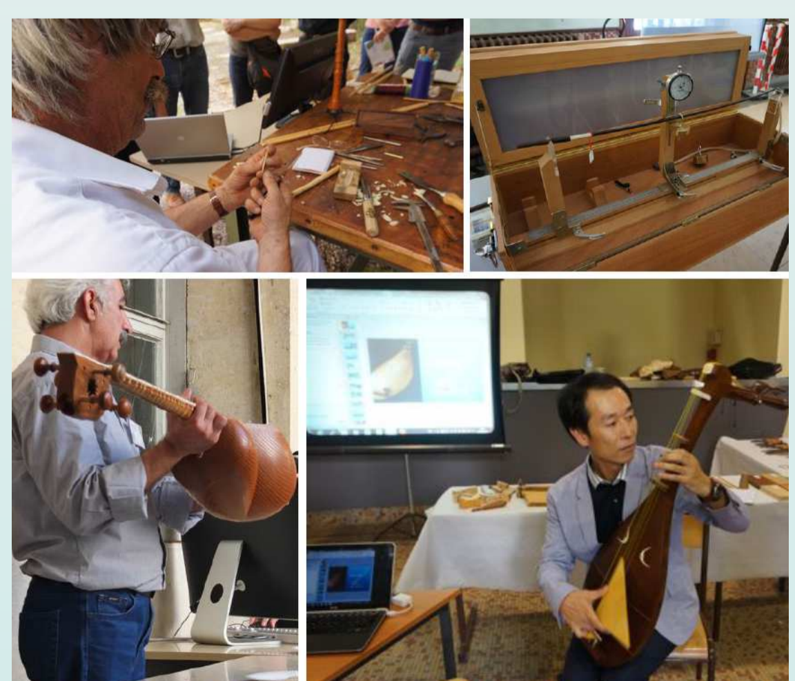
Jeudi 11/09/2014 Finition, vieillissement, vernis