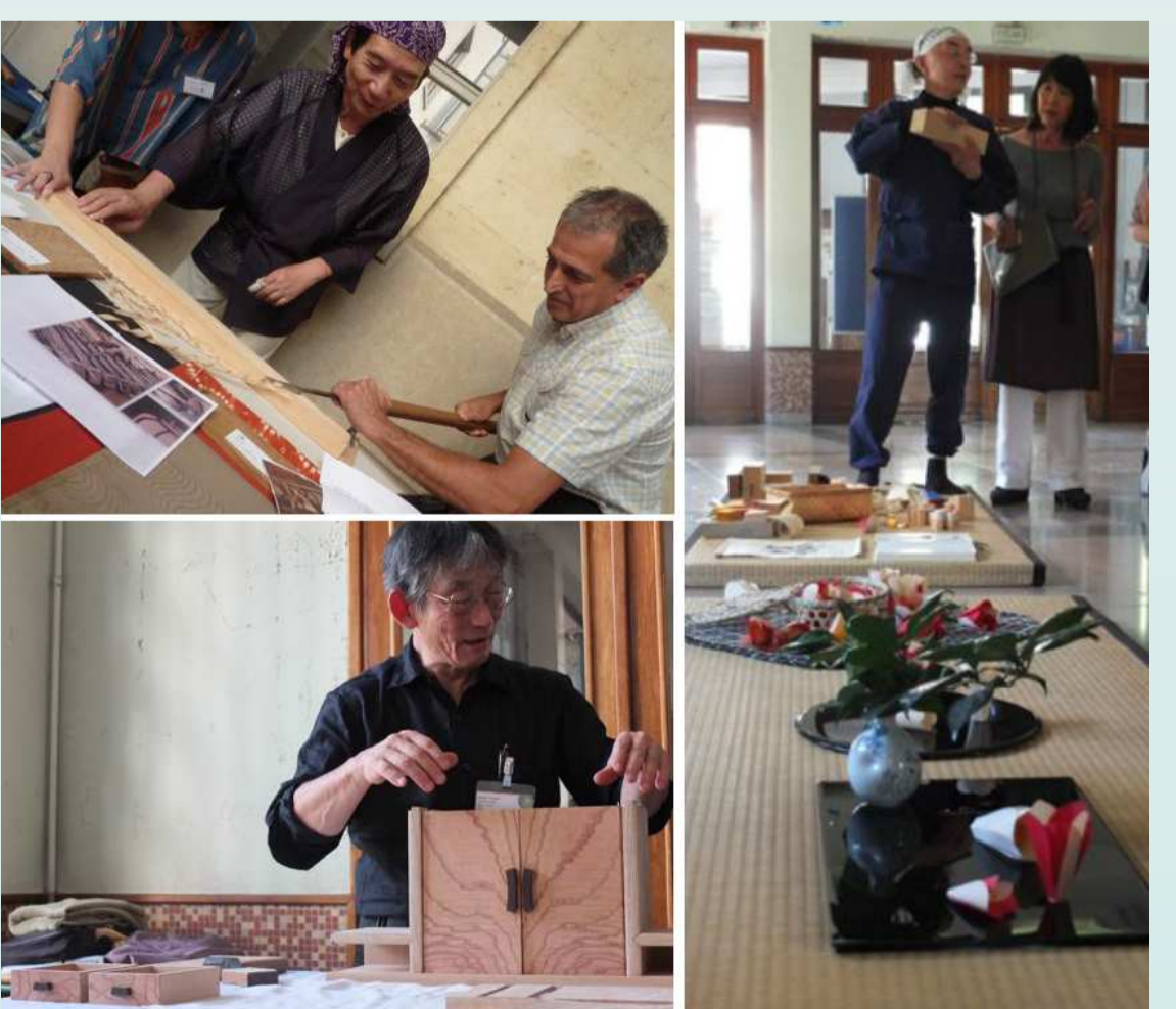
Mercredi 10/09/2014 Facture instrumentale / lutherie