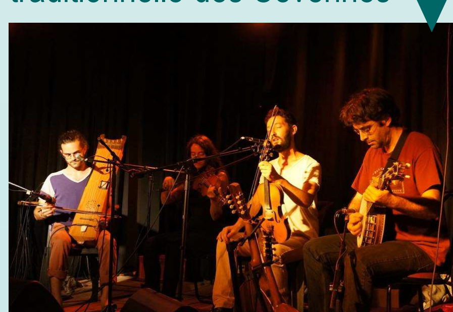
Dîner avec Concert-Bal de musique traditionnelle des Cévennes

Clôture du Symposium: un fort espoir de poursuivre les échanges créés... et beaucoup de nouvelles amitiés!