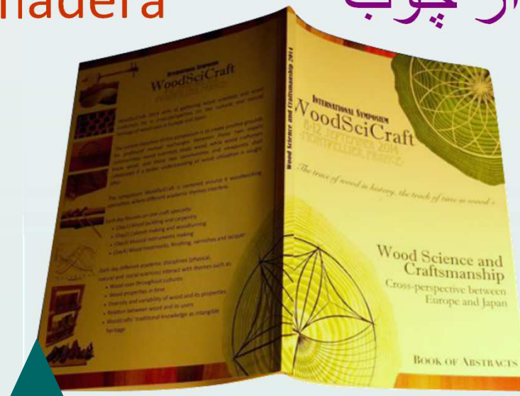
Actes du 1er Symposium WoodSciCraft

legno 木材 bois dřevo hout wood lignum les fusta madera Holz از چوب