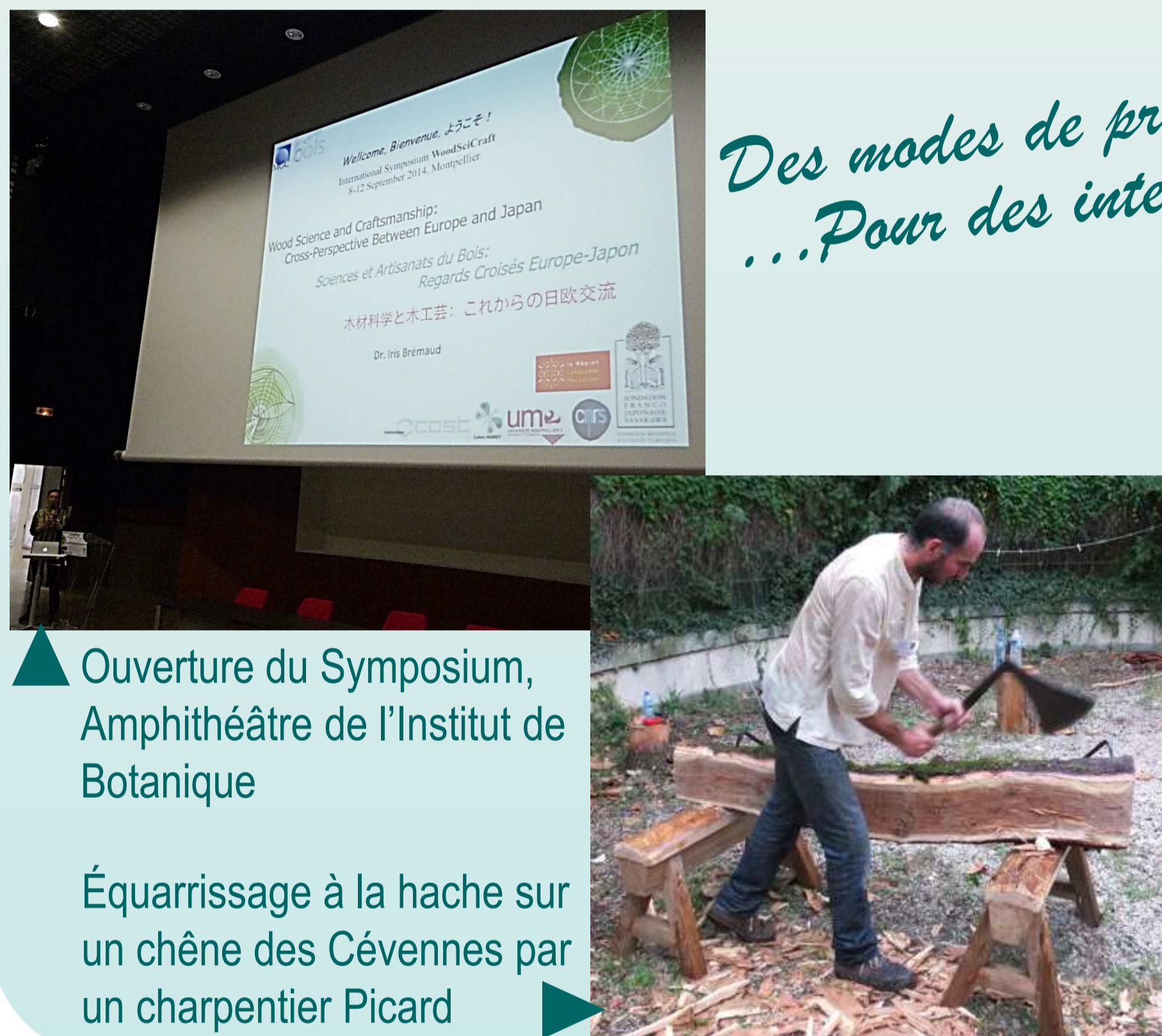
▲ Ouverture du Symposium, Amphithéâtre de l'Institut de Botanique