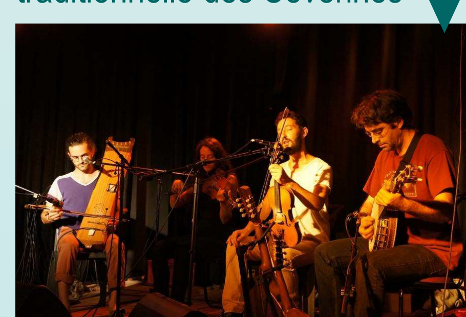
Dîner avec Concert-Bal de musique traditionnelle des Cévennes

Clôture du Symposium: un fort espoir de poursuivre les échanges créés... ...et beaucoup de nouvelles amitiés!