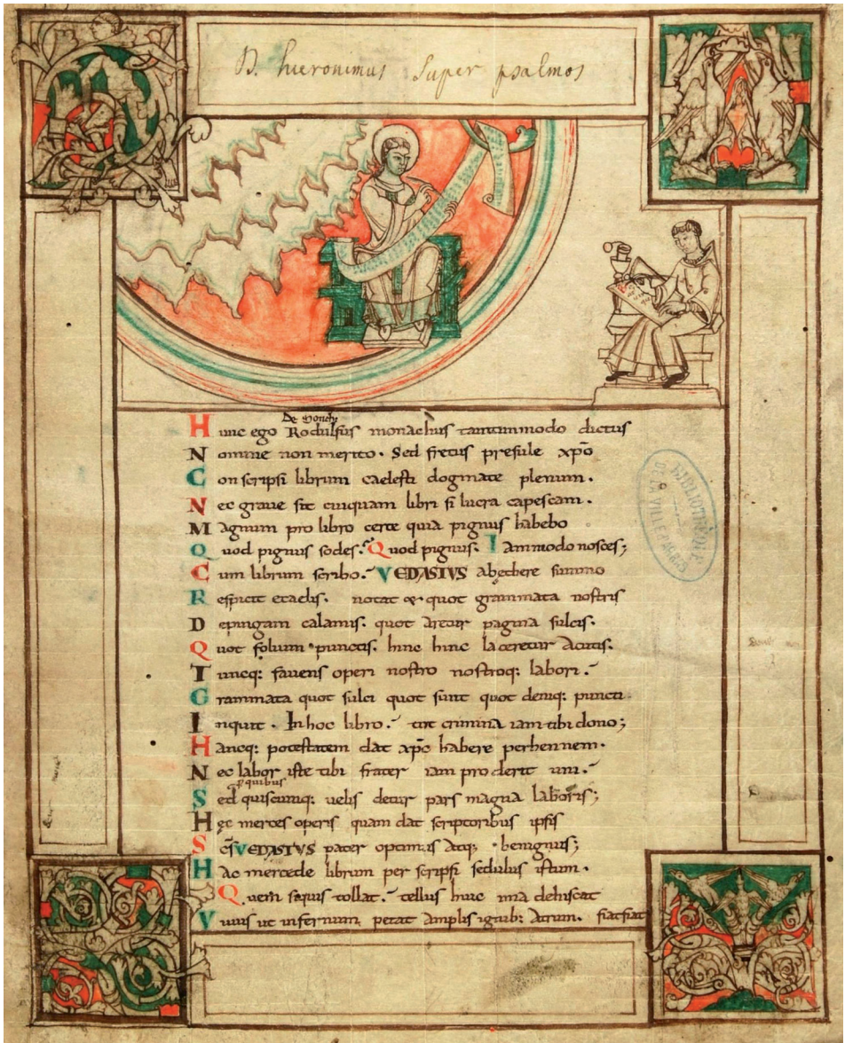
Fig. 7: Arras, Bibliothèque Municipale, ms. 860 [530], fol. 1r (Rodulfus).