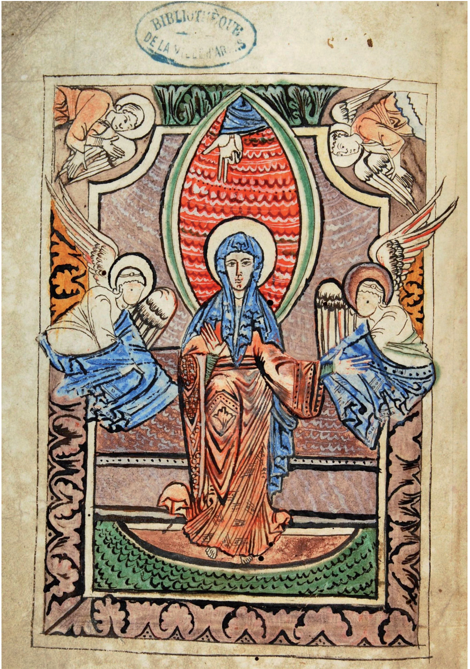
Fig. 6: Arras, Bibliothèque Municipale, ms. 732 [684], fol. 2v (Assomption de la Vierge).