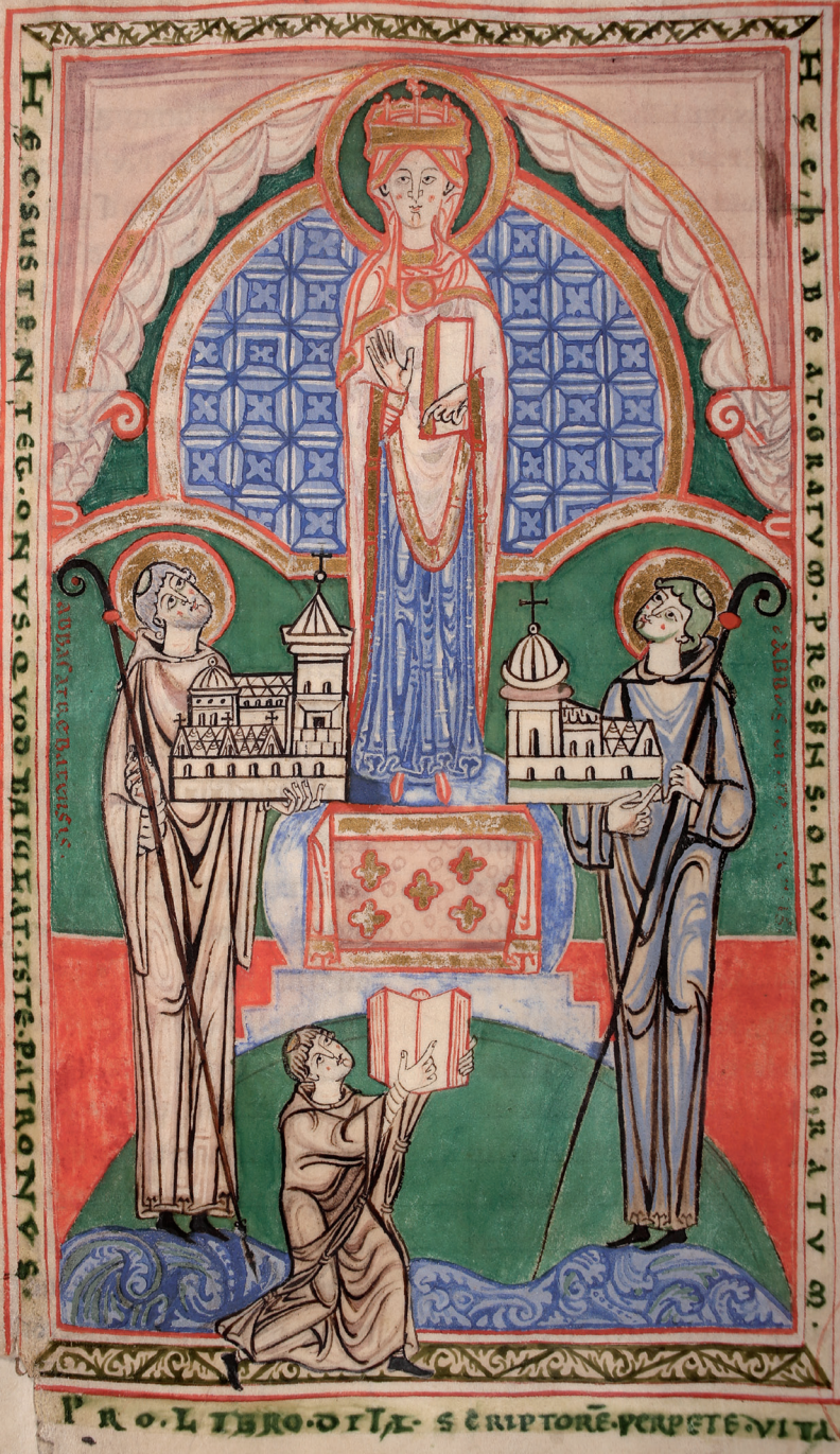
Fig. 4: Dijon, Bibliothèque Municipale, ms. 130 ( Commentaires de Jérôme sur Jérémie ), fol. 104r. (Cl. avec l'aimable autorisation de la bibliothèque municipale de Dijon © BMD).

Fe mitna par sumit maior partibus sibi summi s. hoc uirtus meruit. partus de hoc tribuit.