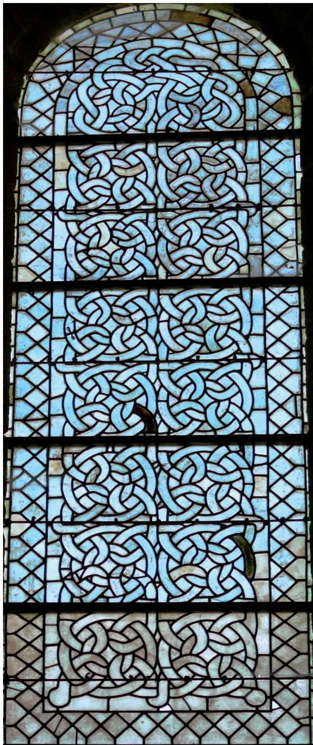
Fig. 5: Aubazine (Corrèze), église abbatiale, vitrail, 2 e moitié du XII e siècle.