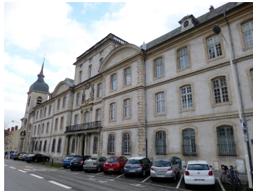
Figure 3 : l'hôtel des missions royales.