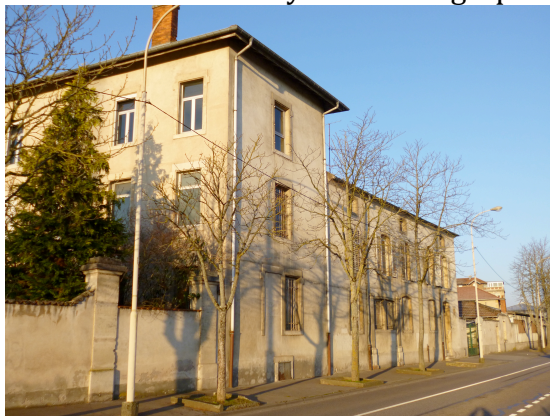
Figure 4 : la maison de campagne du noviciat.