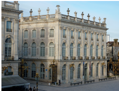
Figure 6 : le pavillon de la Comédie place Stanislas.

Dominique Benoît est membre fondateur du Collège royal de médecine (ou des médecins ) qui regroupe statutairement tous les médecins exerçant à Nancy. Il était effectivement présent à l'assemblée constitutive du 10 septembre 1751 au cours de laquelle le premier bureau a été élu 20 . L'institution dispose d'une partie du pavillon dit "de la Comédie" situé sur la place Royale (aujourd'hui place Stanislas, figure 6).