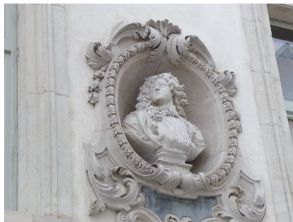
Figure 2 : le buste de Léopold sur la maison Hanus à Nancy.