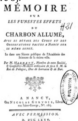
Figure 8 : la première page du travail majeur d'Harmant, "Sur les funestes effets de la vapeur des charbons allumés...", Annales médicales de Nancy , 1968.

Dominique Benoît Harmant est surtout connu pour son "Mémoire sur les funestes effets du charbon allumé, avec le détail des cures et des observations faites à Nancy sur le même sujet". Il a été présenté au cours de la séance publique du 27 février 1764 de la Société royale des sciences et belles-lettres . Il paraît en 1775, imprimé chez Scolastique Baltazard, 82 rue Saint-Julien (figure 8).