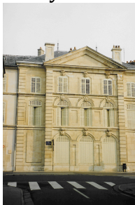
Figure 5 : l'hôpital des Frères de Saint-Jean-de-Dieu.

Dominique Benoît est également médecin de l'hôpital Saint-Stanislas, créé par le duc-roi Stanislas en 1750. C'est l'hôpital des Frères de la Charité de Saint-Jean de Dieu, dont le contrat de fondation est passé à Lunéville le 25 avril 1750 et les lettres patentes de fondation signées le surlendemain. D'abord installé dans une maison mise à sa disposition par la ville, il bénéficie rapidement de la construction rue Neuve-des-Casernes (rue Sainte-Catherine aujourd'hui), d'un bâtiment érigé sur les plans de Héré (figure 5). Le service médical y est assuré par les médecins stipendiés de la ville 16 , mais, sauf erreur de ma part, il n'en est pas question dans le contrat ni dans les lettres patentes. C'est donc à ce titre qu'Harmant y exerce son activité.