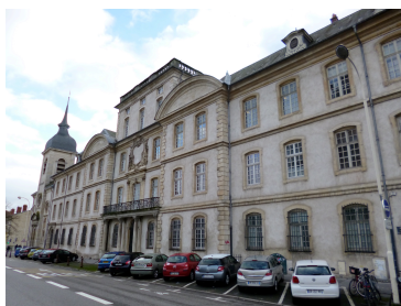
Figure 3 : l'hôtel des missions royales.