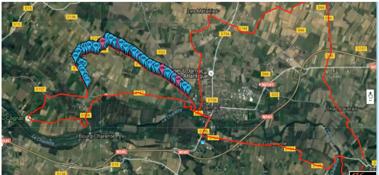
FIG. 1 – Vue Google Map (Marathon du Cognac, Charente).

Notre objectif actuel est de créer une application mobile où le spectateur bénéficie d'une immersion virtuelle 3D de l'épreuve en temps réel comparable à celle, réelle, du Tour de France. Pour cela, une modélisation 3D restreinte aux bornes du parcours a été réalisée. Nous avons utilisé QGIS et son plugin Qgis2threejs assurant une compatibilité avec les navigateurs web et systèmes d'exploitation [8, 9,10], Fig. 3. À cet environnement, nous avons associé des modèles numériques de terrain, des fonds cartographiques (BD ALTI®, RGE ALTI® et BD ORTHO®) par intégration de flux WMS (Service de cartes web) [11,12].