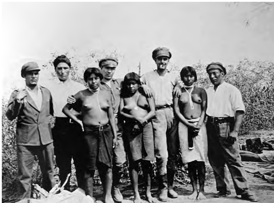
Imagen 2. 1927, Mujeres nivacché en el fortín Esteros (Gumucio, 2002: 74).

los bolivianos. Como siempre hicieron su recorrida por la costa del río y ahí los vieron. Vieron a esos ancianos que estaban pescando en el río. Era de noche y los bolivianos los iban a matar. Iban a matar esos ancianos. Los bolivianos odiaban a los nivacché, nos iban a matar a todos. Los abuelos de nosotros cuidaban esta zona. Los bolivianos no querían que los nivacché vivieran en esta zona. Los bolivianos no los querían en esta parte, porque iban a hacer un fortín [...] Tarija escuchó de los jefes que iban a venir más bolivianos, que iban a ir ocupando la tierra, que iban a ocupar toda la zona de los nivacché. Solo bolivianos iban a quedar en la zona de los nivacché. Así le escuchó decir al coronel Peña, en Muñoz, que era jefe de los bolivianos. Ahí había una “casa grande”, al igual que en Media Luna. Ahí también había una “casa grande” y muchos bolivianos. Tarija se quedaba callado y escuchaba nomás. Pero al otro día los militares ya estaban esperando a los abuelos de Tarija, que venían de la pesca. Siempre se iban a pescar esos abuelos, todos los días, siempre y al día siguiente ya regresaban a su aldea en Ftsuuc. Esa vez los bolivianos llegaron a la costa del río y empezaron a dispararles. Les dispararon de cerca y por la espalda, los mataron a todos, ahí en donde estaban pescando. Les dispararon