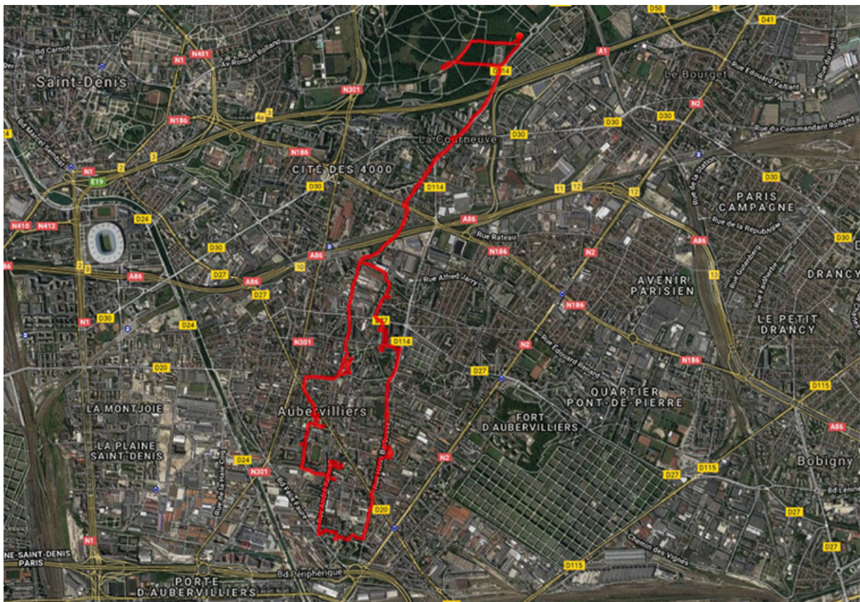
5. Exemple d'un parcours urbain, « Transhumance urbaine » n°3, Du parc G. Valbon (La Courneuve) à la porte d'Aubervilliers. (Leterrier et Bories, 2018)

La seconde particularité relève de la forme de l'itinéraire. La ligne du parcours n'est jamais directe. Il dessine une mobilité sinueuse, assez différente des mobilités urbaines habituelles où le trajet cherche généralement à emprunter le plus direct, le plus court en distance ou le plus économe en temps. L'itinéraire est aussi un circuit. Autrement dit le déplacement n'est jamais un aller/retour par le même chemin. Le « bouger en ville » de l'animal s'opère dans une forme de déambulation en boucle plus ou moins circulaire.