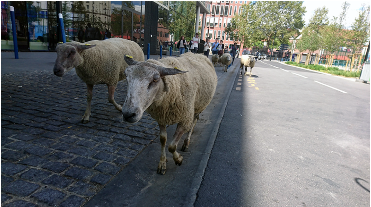
Troupeau en parcours dans les rues d'Aubervilliers.