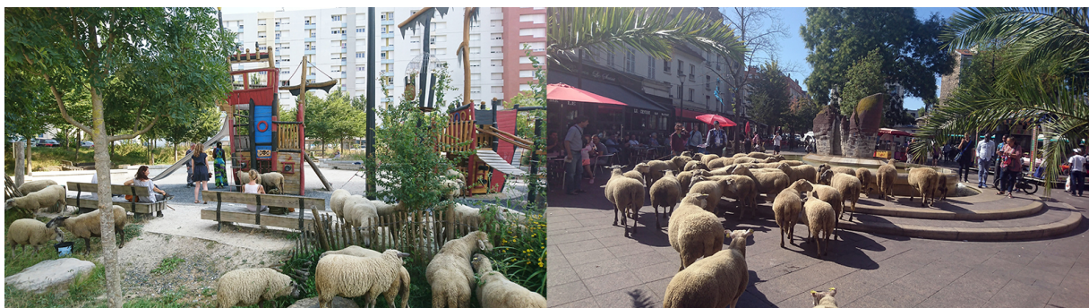
7. Des espaces interrupteurs du mouvement. (Leterrier, 2018)

Si le déplacement est lent, qu'il se fait à pied, il est aussi arythmique. Les lieux de pâtures qui sont principalement les bords de talus, les espaces verts des squares en pied d'immeubles agissent comme des interrupteurs de cette circulation animale. Ces interrupteurs du mouvement sont aussi plus curieusement des aires de jeux pour enfants ou des fontaines de quartier, ce qui pour les fontaines interroge le détournement de fonction et l'usage du mobilier urbain, de la décoration à l'abreuvoir.