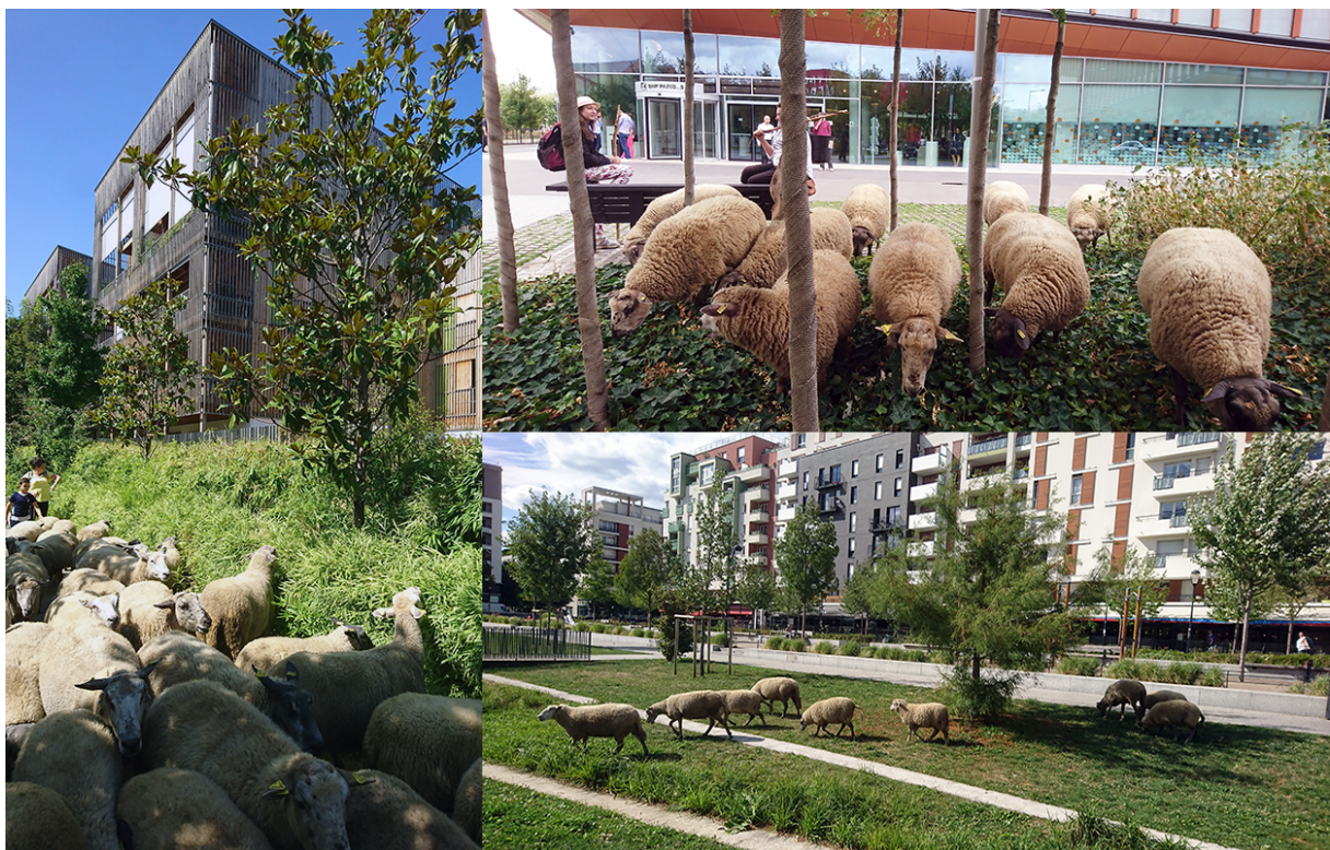
6. Des espaces de pâtures urbaines. (Leterrier, 2018)

de l'animal introduit en ville par la forme sinueuse du trajet un autre rapport au déplacement et à la mobilité. Le repérage du circuit s'effectue avant chaque départ par les bergers notamment par l'identification de voies vertes, des ponts et autres passages souterrains piétonniers. Le repérage du circuit relève aussi d'un souci d'anticipation d'éventuels problèmes, par exemple une route provisoirement barrée et d'adaptation à la réalité du moment avec des solutions de replis. Le balisage de l'itinéraire se construit chemin faisant. Il s'établit aussi par l'opportune présence d'un espace enherbé. Pour autant, l'itinéraire en circuit et autres détours n'est pas uniquement un hasard d'opportunité et de rencontre avec les terrains de pâtures urbaines. Le parcours est ici la trace géographique d'une très fine connaissance territoriale, acquise par le berger, tel un arpenteur, à mesure des sorties et des découvertes. La déambulation de l'homme et du troupeau dans l'espace urbain n'est pas aléatoire et se construit à partir d'un jeu de mémorisation de lieux et d'habitudes qui nous renseigne sur la qualité d'un rapport au terrain qu'il connaît par cœur, lui donnant l'avantage d'une improvisation contrôlée.