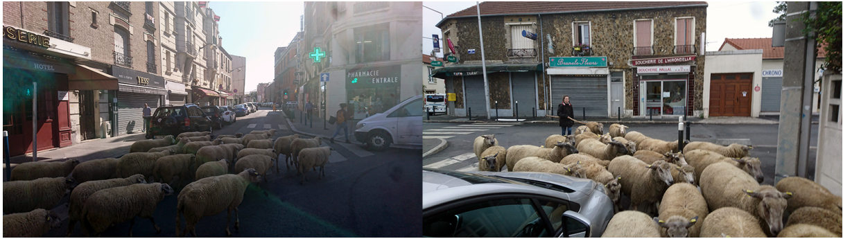
2. Exemple d'images, Parcours de cités dans l'intercommunalité de Plaine Commune, « Transhumance urbaine » n°2, 25 juillet 2018.