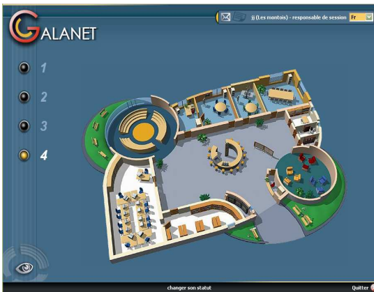
Figure 1. Galanet – Interface d'accueil

Le scénario d'encadrement , quant à lui, a été élaboré au fil des sessions. Initialement prévu sous forme d'accompagnement souple et proactif, sans autre spécification particulière, et laissé à l'appréciation de chaque équipe, le rôle des tuteurs s'est progressivement affiné, du fait notamment de l'insertion curriculaire de la formation 24 . Deux initiatives ont contribué à renforcer et à structurer la dimension tutorale à distance : l'élaboration d'une «charte d'utilisation de Galanet» 25 , destinée à réguler et à soutenir la participation des étudiants aux forums et aux chats, et la mise en place d'une formation des tuteurs, conçue également à distance, mais à partir d'un autre environnement numérique de travail 26 . Cette formation, prévue sur une durée de cinq semaines environ, définit et exemplifie, par une démarche réflexive, les fonctions du tuteur à chaque étape de la session et clarifie la nature de ses interventions pour chaque type de fonctionnalité utilisée.