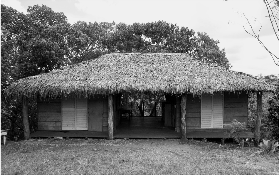
Fig. 2. Le Centre de musique Tura Nambe , 21 octobre 2011.

Young Life, Shanty Town, etc.). Enfin, la location de l'équipement (instruments et matériel de sonorisation) était également très demandée.