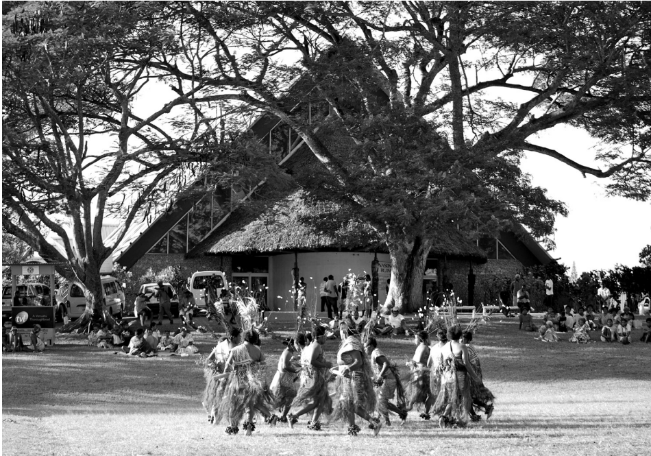
Fig. 1. Les célébrations de l'indépendance devant le Centre Culturel du Vanuatu (VKS), 2 août 2010.

sur ce qui se dit à propos d'eux et de leur culture leur échappe. C'est pourquoi, il est explicitement demandé à chaque chercheur de fournir à la communauté étudiée et au VKS, en dehors de leurs travaux académiques, ce qu'on pourrait appeler « un travail dérivé » ou un travail de valorisation (documents photographiques, audio et audiovisuels, livrets de contes, manuels scolaires en langues vernaculaires, transcriptions et traductions des mythes, etc.)