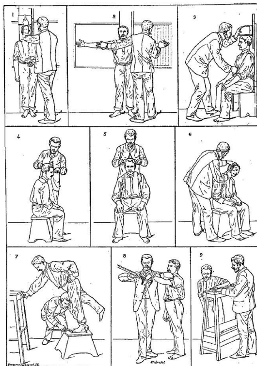
1. Taille. — 2. Envergure. — 3. Buste. — 4. Longueur de la tête. — 5. Largeur de la tête. — 6. Oreille droite. — 7. Pied gauche. — 8. Médius gauche. — 9. Coudée gauche.